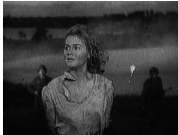
„Marytė“, rež. Vera Strojėva, 1947

„dideliu vyru“, kad yra išskirtinė, visa galva pralenkusi kitus. O svarbiausia – todėl, kad kovotoja apibrėžiama ne per santykį su vyru, bet per santykį su priešu, kurį privalo triuškindi be pasigailėjimo.