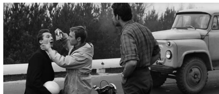
„Suaugusių žmonių žaidimai“, novelė „Žlugimas“, rež. Ilja Rud-Gercovskis, 1967