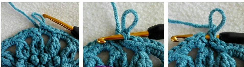
Cheerful Echinacea by Sari Åström