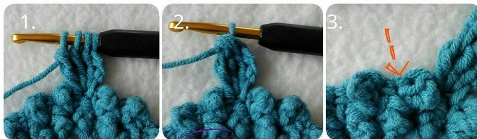
Cheerful Echinacea by Sari Åström