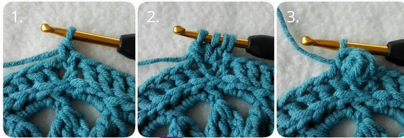
Cheerful Echinacea by Sari Åström