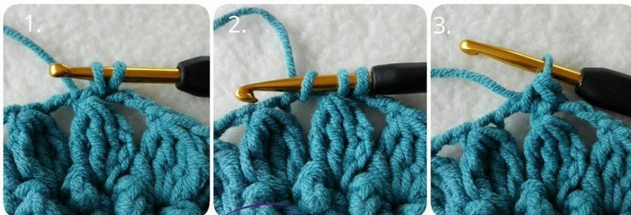
Cheerful Echinacea by Sari Åström