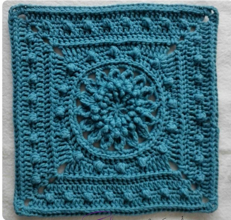
Cheerful Echinacea by Sari Åström