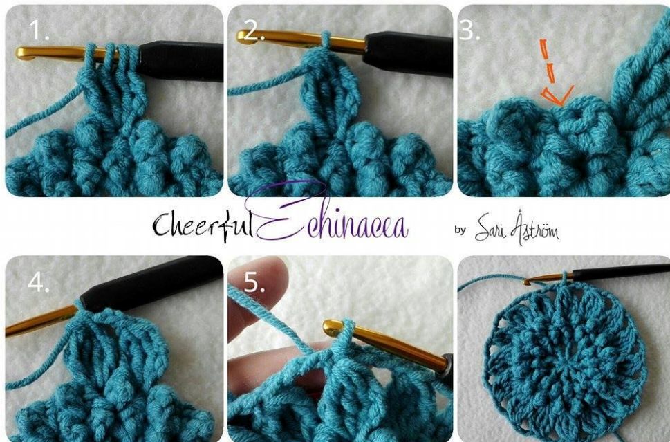
Cheerful Echinacea by Sari Åström

Maschenanzahl: 16 Blütenblätter (aus 4 DStb) und 16 3-Lm-Räume.