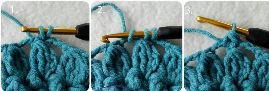
Cheerful Echinacea by Sari Åström