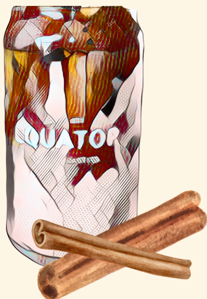
Maple Shaken Espresso $6.80 Espresso secoué à l'érable