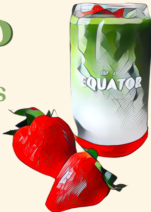
Strawberry Matcha $6.90 Matcha aux fraises