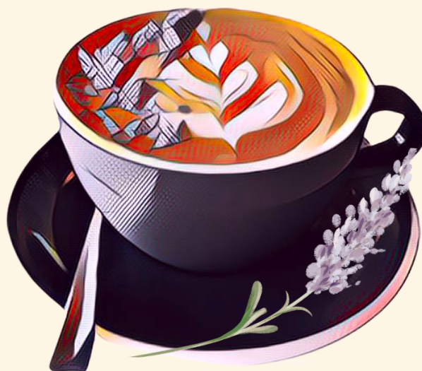
Honey Lavender Latte $6.50 Latté Miel Lavande

*Taxes and large sizes not displayed* *Taxes et grands formats non affichés*