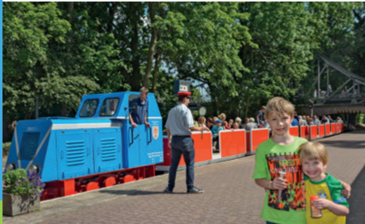
Parkeisenbahn Peißnitzexpress