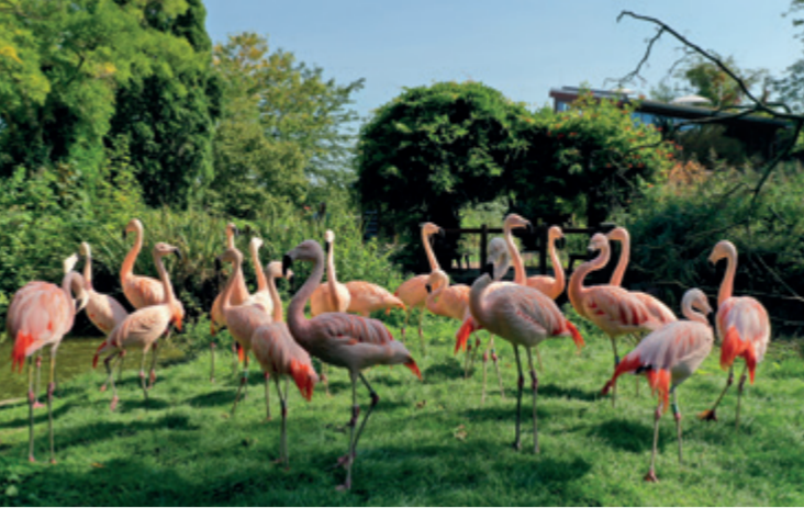
Bergzoo Halle