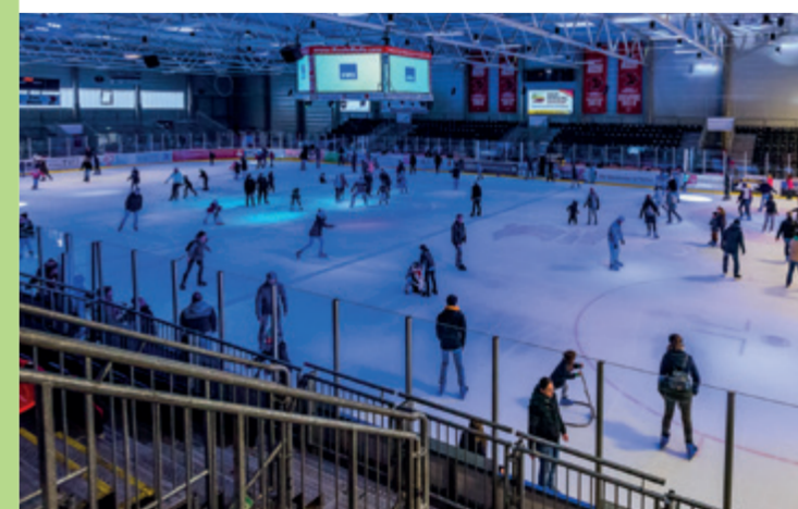
Eislaufen in Halle (Sparkassen-Eisdome)