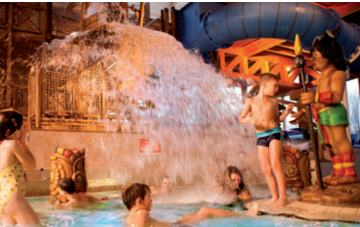
Maya mare – Mexikanisches Bade- und Saunaparadies