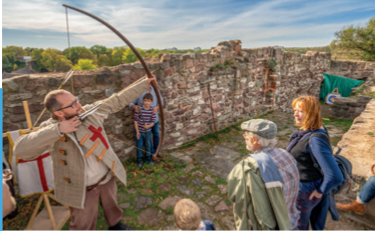
Oberburg Giebichenstein