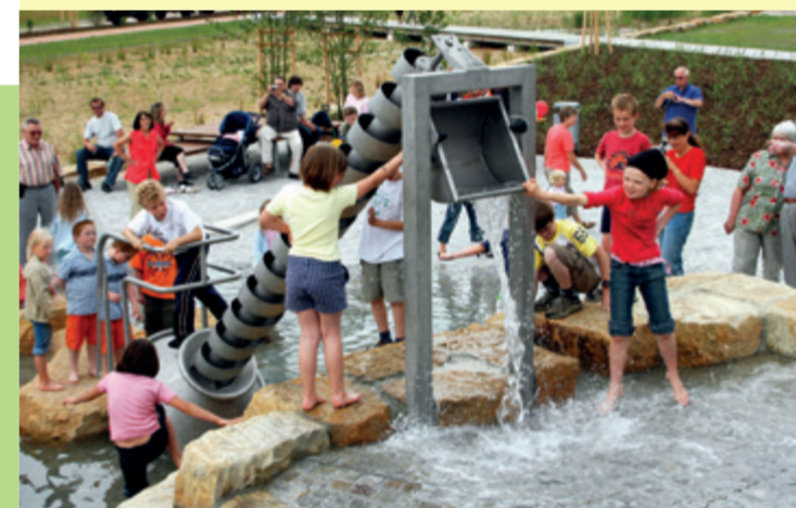
Wasserspielplatz Heide-Süd