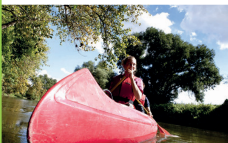
Paddeln auf der Saale