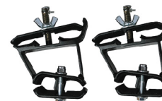
Monturas de hacha y pala para portaequipaje de 3" de altura