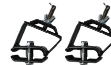
Montura de gato para portaequipaje de 3" de altura