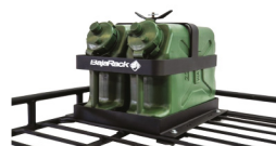
Soporte de Bidón de Agua