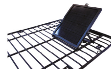
Montura de panel solar