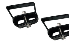
Montura de toldo para portaequipaje de 3" de altura (2 piezas)