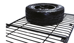
Montura de llanta