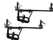
Montura de Maxtrax para portaequipaje de 3" de altura