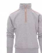
GRIGIO MELANGE /ARANCIO