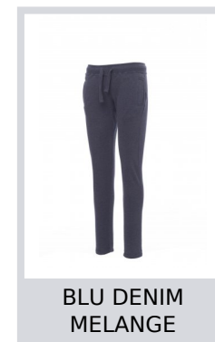
BLU DENIM MELANGE