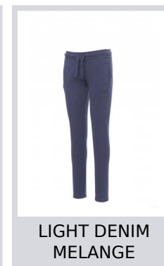
LIGHT DENIM MELANGE