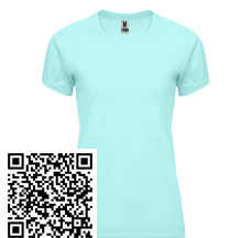
BAHRAIN WOMAN CA0408