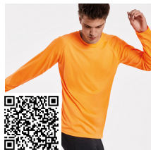
MONTECARLO L/S CA0415