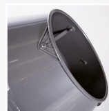
Refuerzo boca de tambor