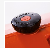
Perilla tensor de correa