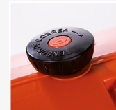
Perilla tensor de correa