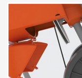
Tapa de inspección