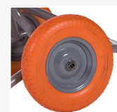
Rueda foam CÓDIGO 01/32