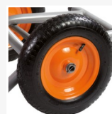
Rueda neumática CÓDIGO 01/31