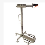
Estación de trabajo (OPCIONAL)