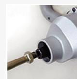
Sistema de engranaje de alta resistencia