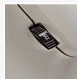
Velocidad regulable sinfín