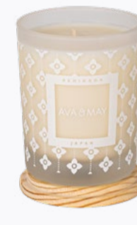
MASSAGEKERZEN 140g | Für etwa 10 Rückenmassagen