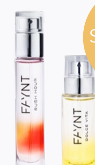
FAYNT PARFUMS 10 - 50ml Düfte für jeden Moment