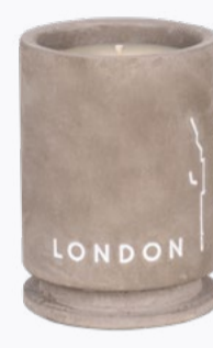
BETONKERZEN 220g | 45 Std.