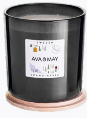
GROSSE DUFTKERZEN 500g | 70 Std.