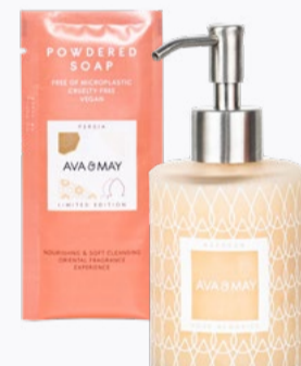
POWDERED SOAPS 200ml nachhaltige Seife