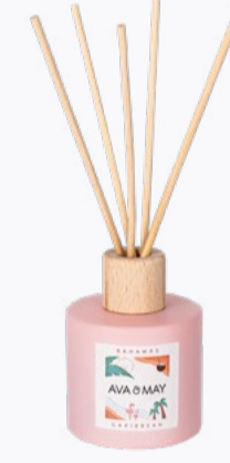
DUFTSTÄBCHEN 100 ml