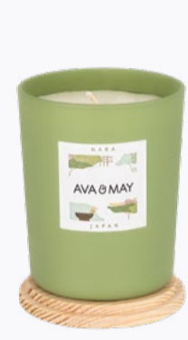
DUFTKERZEN 180g | 40 Std.

Bei AVA & MAY findest du ganz sicher das Richtige für dich - denn dort gibt es eine große Auswahl an Home & Living Produkten!