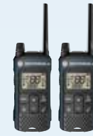
2 radios T465MC