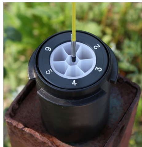
Mediciones hechas a través de los canales angostos del sistema Multicanal CMT de Solinst.

El medidor Mini se ofrece en longitud única de 25 m o 80 pies Se puede suministrar con las sondas P4 o P10.