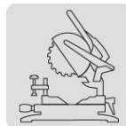
Para sierra de inglete