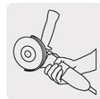
Mayor ergonomía y confort