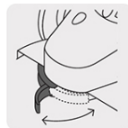
Guarda de ajuste rápido