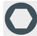
Fijación con tornillo hexagonal