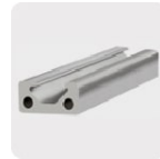
Metales no ferrosos