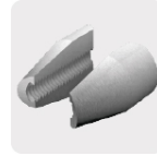
Mordazas de acero