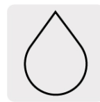
Para cortes en húmedo