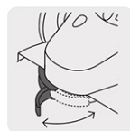
Guarda de ajustes rápido