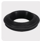
Empaque antifuga con diseño cónico