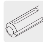
Para rotomartillos SDS Plus