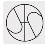
Punta Split Point