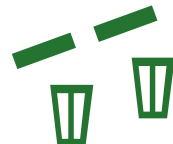
Mandjes met afsluitdop