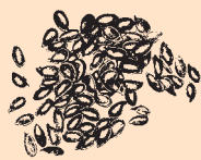
British Grown Linseed