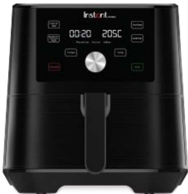
Freidora de Aire 5.7 Litros