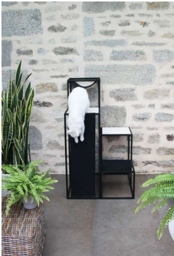
Blanco fait ses griffes sur l'Arbre à Chat Élégance Format XXL