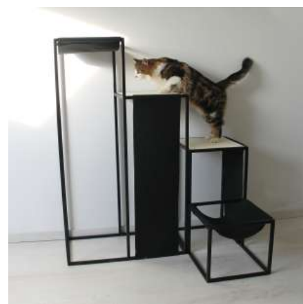
Choupi gravit son Arbre à chat Éléance Format XXL

Inscrite dans une logique éco-responsable, Homycat continue dans sa lancée et propose un arbre à chat indestructible et durable qui inclut notamment l'upcycling dans sa création, une démarche qui consiste à transformer des déchets en nouveaux produits dans une logique d'économie circulaire et de consommation durable.