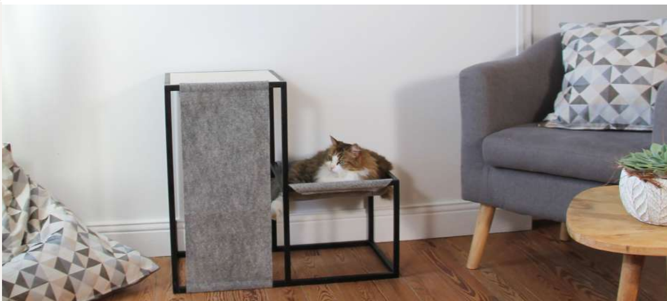
Nouméa se prélassé dans le hamac de son Arbre à Chat Élégance Format S

Disponible dès le 11 novembre 2021 sur www.homycat.com sous forme de pré-commande, l'arbre à chat Élégance sera proposé à prix réduit avec jusqu'à 120€ offerts pour l'achat d'un produit de la nouvelle gamme Distinction avant le 5 janvier 2022. Plusieurs tailles et variantes disponibles à partir de 299,00€ TTC.