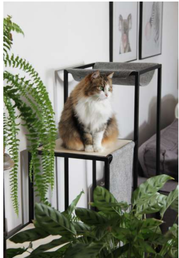
Nouméa observe le monde du haut de son arbre à chat Élégance Format XL