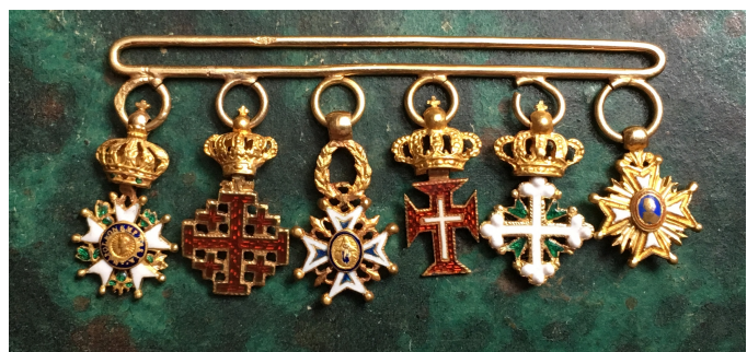
M gr Charles-Thomas Thibaut.