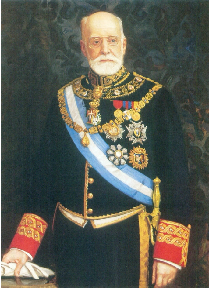
Alejandro Groizard y Gómez de la Serna.