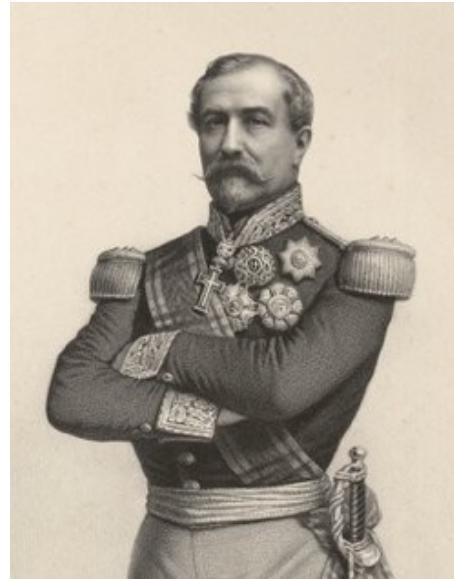
Christophe Juchault de Lamoricière.