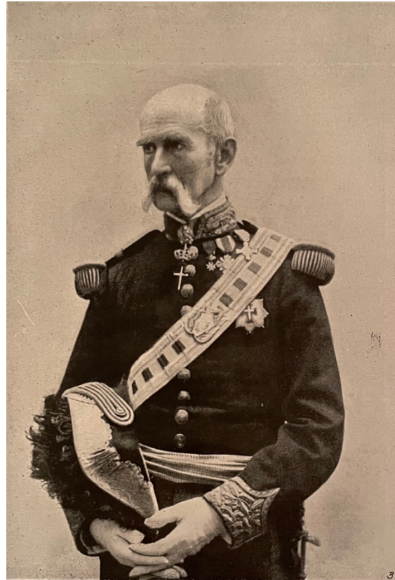
Emilio prince Altieri.