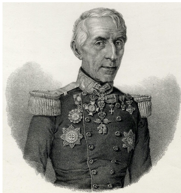
Silvestro Dandolo.