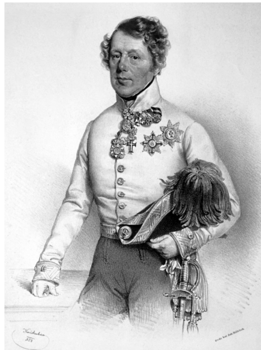
Johann Baptist von Paumgarten.