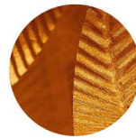
Brass fibre Fibre de laiton