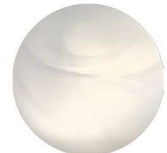
Alabaster White glass Verre Blanc Albâtre