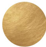
Brushed Gold Or Brossé