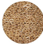
Gold chain Chaîne or