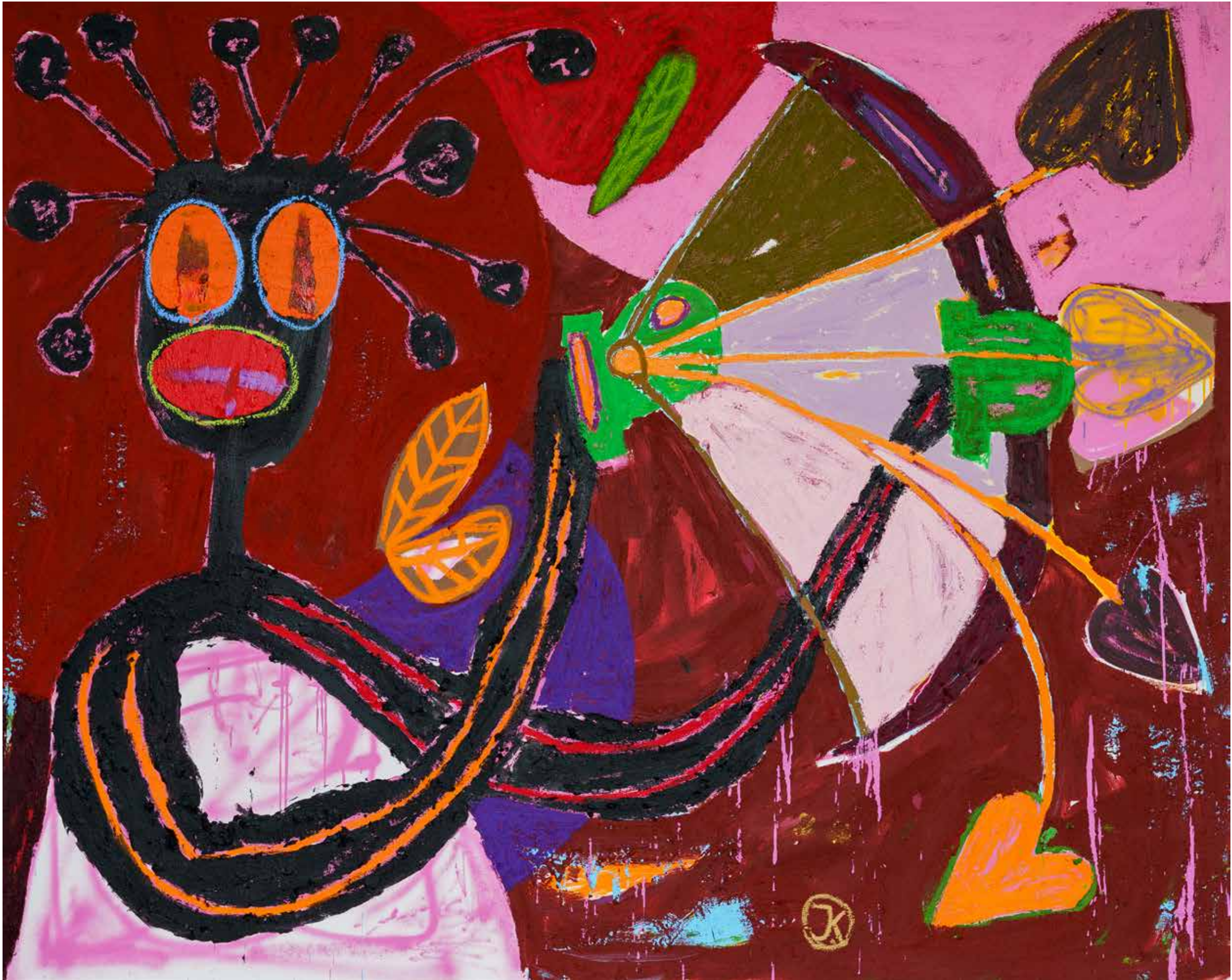
LOVE STORIES 2023 Acrylic, oil stick, paper, sand and oil pastel on canvas 200 x 250 cm