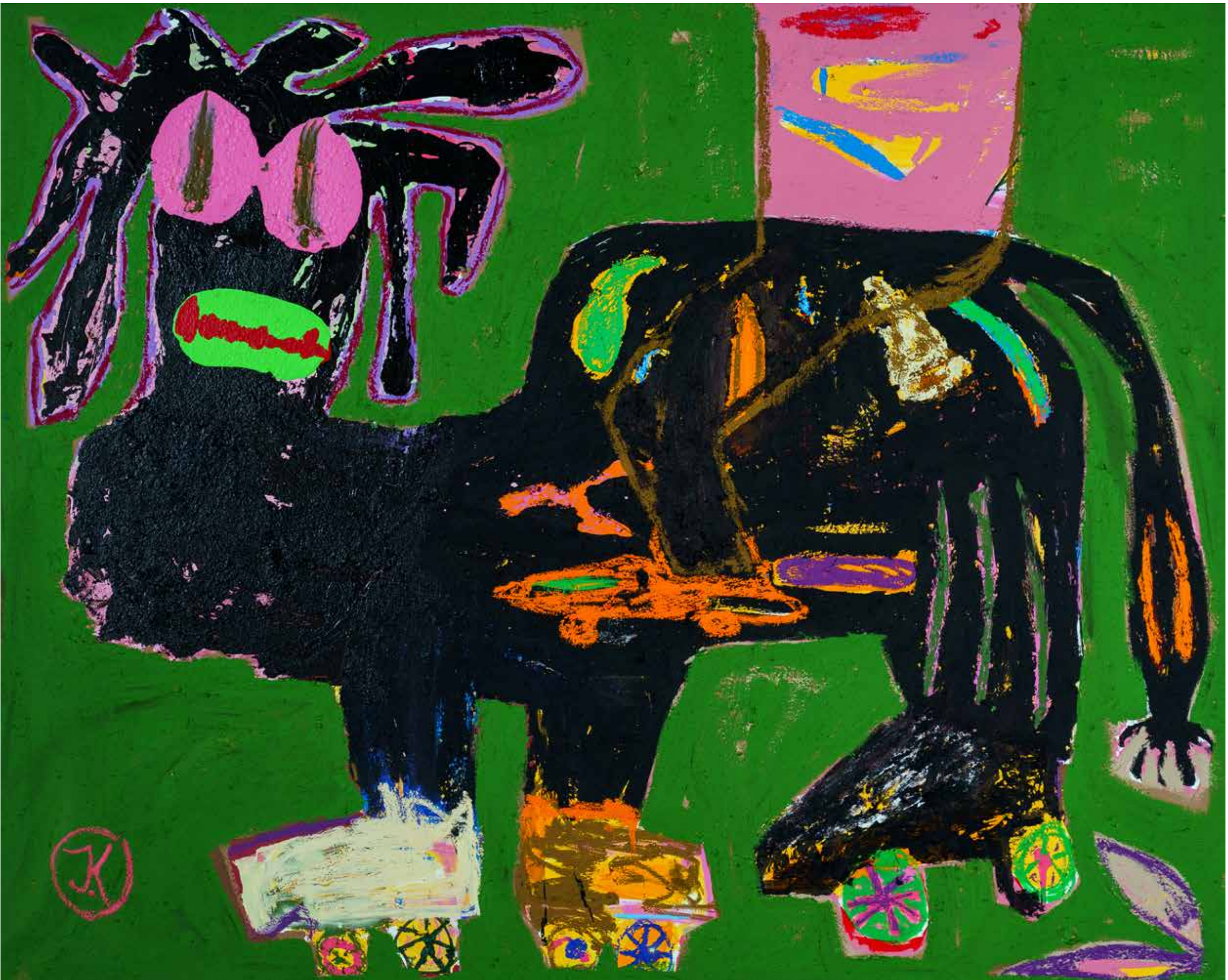
JACK OG OTTO 2023 Mixed media on canvas (paper, acrylic, oil, oil stick, dry pastel and sand) 250 x 200 cm