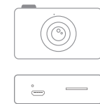
Size: 78mm*48mm*43mm Weight: 65g

Pakket omvat: camera host X1, kabel X1, cartoonsticker X1, instructie X1. Micro USB OTG adapter Das Paket enthält: Kamerahost X1, Kabel X1, Cartoon-Aufkleber X1, Anleitung X1. Mikro-USB-OTG- X1, Type C OTG adapter X1 Adapter X1, Typ C OTG-Adapter X1