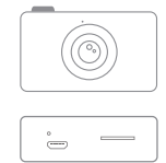
Size: 78mm*48mm*43mm Weight: 65g

Package includes: camera host X1, cable X1, cartoon sticker X1, instruction X1. Micro USB OTG Le forfait comprend : hôte de la caméra X1, câble X1, autocollant de la bande dessinée X1, adaptateur X1, Type C OTG adaptateur X1 instruction X1. Adaptateur OTG micro USB X1, adaptateur OTG de type C X1