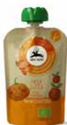
PUREA DI MELA E ZUCCA