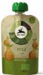
PUREA DI PERA