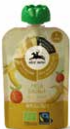
PUREA DI MELA E BANANA