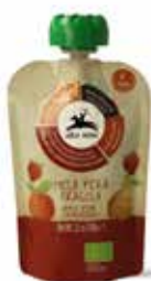
PUREA DI MELA, PERA E FRAGOLA