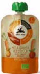
PUREA DI MELA, CAROTA E ALBICOCCA