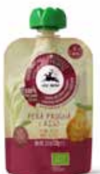
PUREA DI PERA, PRUGNA E RISO