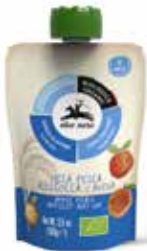
PUREA DI MELA, PESCA, ALBICOCCA E AVENA