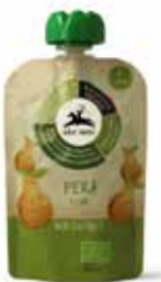
PUREA DI PERA