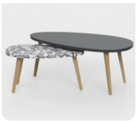
TABLE BASSE BELLECOMBE