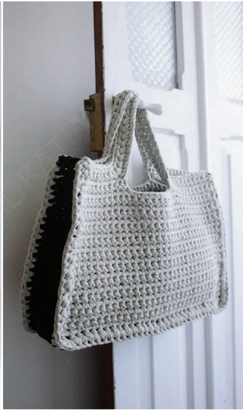
63. BIG RIBBON