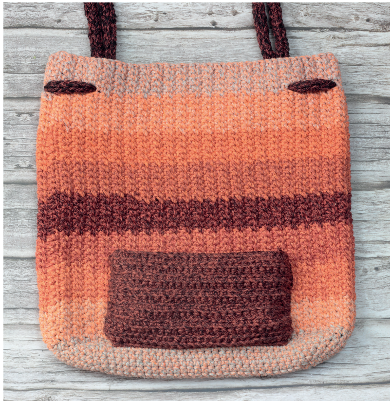
Bolsillo interno (vista del bolso del revés) / Tasca interna (vista al rovescio) / Bolso interno (bolso visto do avesso)