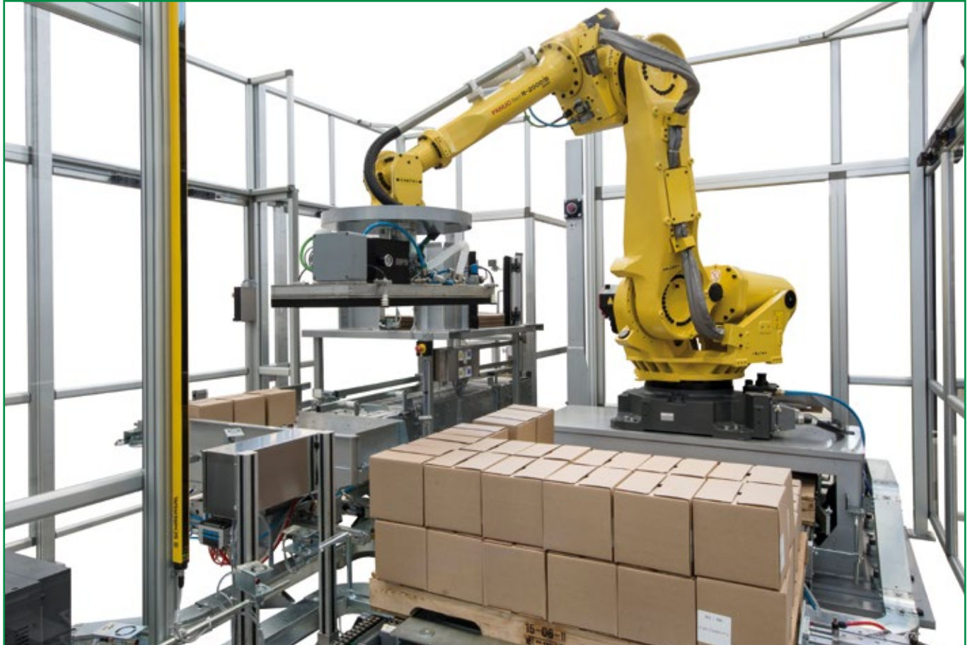
Pallettizer, model GRP Pallettizzatore modello GRP