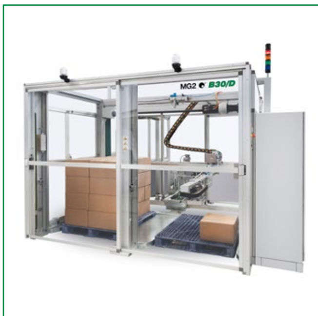
Double-bay palletizer, model B30/D Palletizzatore doppio modello B30/D