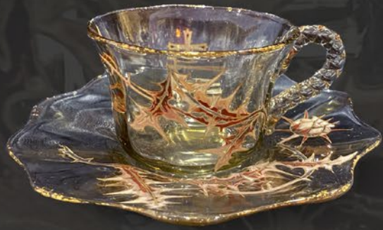
エミール・ガレ 薔薇文カップ&ソーサー フランス 19世紀末頃 エナメル彩、アブリカッション、金彩 高さ12×幅6.4×奥行6.4cm 税込 858,000円