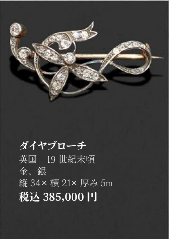
ダイヤブローチ 英国 19世紀末頃 金、銀 縦34×横21×厚み5mm 税込 385,000円