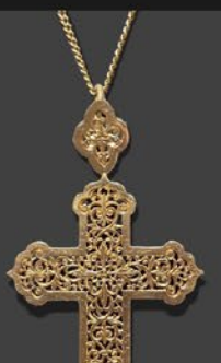
彫金クロスペンダント フランス 1900年頃 18金 縦54×横30×厚み6mm 55cm 税込 528,000円