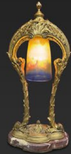
ミュラー アールヌーヴォー卓上ランプ フランス 20世紀初期頃 縦45×横21×奥行14cm 税込 693,000円