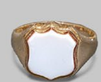
シグネットリング 英国 1900年刻印 サードニクス、9金 幅14×厚み4.5mm 18号(サイズ直し無料) 税込 275,000円