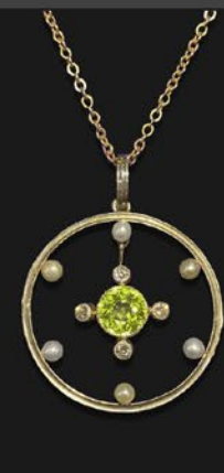
エドワードリアン・ ペリドットペンダント 英国 1910年頃 プラチナ、金、9金チェーン 縦31×横28×厚み4mm 41cm 税込 330,000円