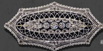
オープンワーク ダイヤモンドブローチ 英国 1910年頃 プラチナ、18金 縦26×横52×厚み3mm 税込 1,980,000円 プラチナと金を組み合わせた板を職人が糸鋸を使用し透かし彫りにし全てのエッジには極小のミル打ちがなされた驚異の作品。中央にはオールドカットのダイヤが五つミル留めされ、その周囲をローズカットダイヤが輝きを添え、さらに驚かされることは一見小さなダイヤが輝いているように映るのは彫り上げられた無数のプラチナのカットされた粒である。