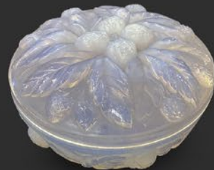
エトラン ボンボニエール フランス 20世紀前期頃 オパールセント硝子 縦8.5×横16.5×厚み16.5cm 税込 297,000円