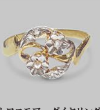
トワエモア・ダイヤモンドリング フランス 1910年 プラチナ、18金 幅10×厚み3mm 15.5号(サイズ直し無料) 税込 99,000円