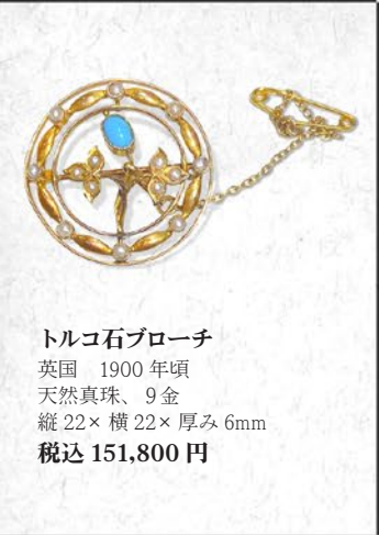
トルコ石ブローチ 英国 1900年頃 天然真珠、9金 縦22×横22×厚み6mm 税込 151,800円