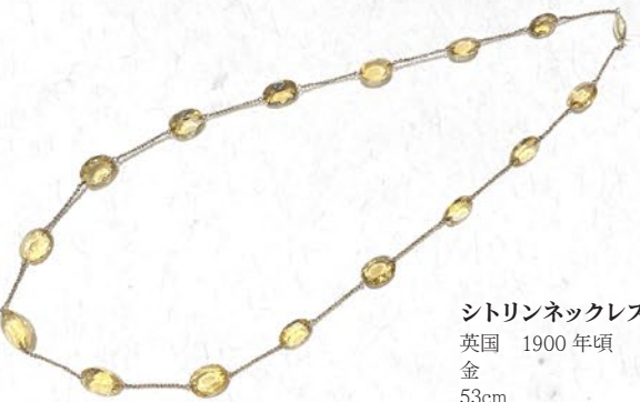
シトリンネックレス 英国 1900年頃 金 53cm 税込 426,800円

昨今はヨーロッパの市場でも目にすることが少なくなった大振りのローズカットを使用したスプレーブローチ。ダイヤモンドの原石の形を残したガードルを覆輪で囲むセッティングはまさにジョージアン期の特徴。立体的なダイヤモンドの花が胸元に華開く逸品。