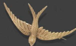
燕彫金ブローチ 英国 1900年頃 15金 縦30×横52×厚み6mm 税込 495,000円