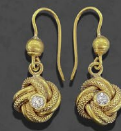
ダイヤモンドピアス 英国 19世紀末頃 金 縦27×横11×厚み8mm 税込 261,800円