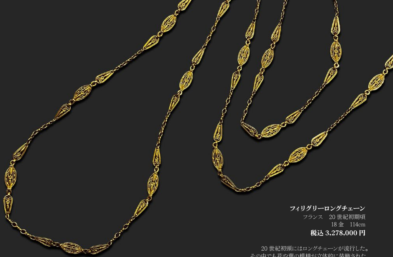
フィリグリーロングチェーン フランス 20世紀初期頃 18金 114cm 税込 3,278,000円

20世紀初頭にはロングチェーンが流行した。その中でも花や葉の模様が立体的に装飾された希少なチェーン、留め具の受けにはフランス製の18金を示す刻印が打たれている。昨今は金の大幅な価格上昇とともにフランスでもその数を急激に減らしている。