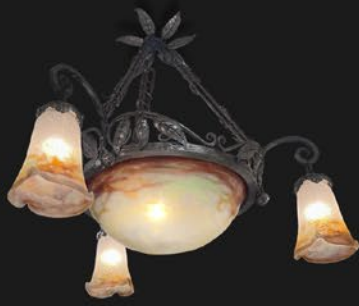
ミュラー 吊りランプ フランス 20世紀初期頃 ヴィクトリフィカシオン 縦62×横62×奥行59cm 税込 825,000円