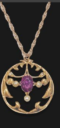
エドワードリアン ガーネットペンダント 英国 1910年頃 天然真珠、15金、9金チェーン 縦29.5×横26.5×厚み5mm 55cm 税込 297,000円