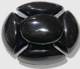
ウィットビージェットブローチ 英国 19世紀後期頃 縦48×横39×厚み20mm 税込 88,000円

ジェットとは今からおよそ1億8000万年前ジュラ期の木の化石。流木が海底に堆積し圧力と経年により化学変化した物。古代ケルトからローマ時代、中世にかけて魔除け護符として重宝された。英国のヨークシャー地方ウィットビーでは漆黒の輝きを放つ良質なジェットを産出し、19世紀にはモーニングジェエリーとして流行した。