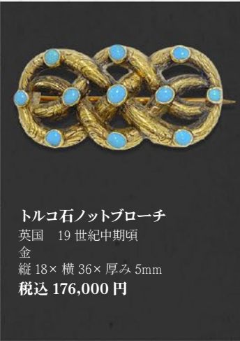
トルコ石ノットブローチ 英国 19世紀中期頃 金 縦18×横36×厚み5mm 税込 176,000円