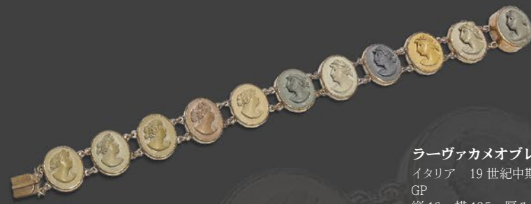
ラーヴァカメオブレス イタリア 19世紀中期頃 GP 縦16×横185×厚み5mm 税込 165,000円