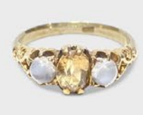
シトリン & ムーンストーンリング 英国 1900年頃 15金 幅7×厚み5mm 14.5号(サイズ直し無料) 税込 239,800円