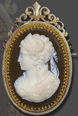
ストーンカメオ ブローチ & ペンダント フランス 19世紀後期頃 天然真珠、サードニクス、金 縦48×横29×厚み11mm 税込 880,000円