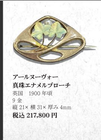
アールヌーヴォー 真珠エナメルブローチ 英国 1900年頃 9金 縦21×横31×厚み4mm 税込 217,800円