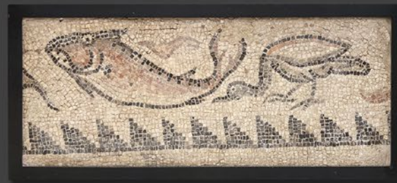
古代ローマモザイクレリーフ 東地中海域 額寸：縦51×横115cm 税込 3,850,000円