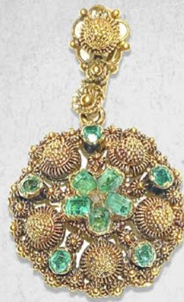
エメラルド金線糸細工 ペンダント 英国 19世紀初期頃 ダイヤモンド、金 縦32×横19×厚み6mm 税込 418,000円