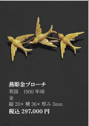
燕彫金ブローチ 英国 1900年頃 金 縦20×横36×厚み3mm 税込 297,000円