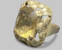
シトリンリング 英国 1950・60年頃 金 幅21×厚み10mm 10号(サイズ直し無料) 税込 187,000円