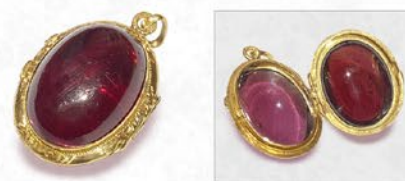
ガーネット・ロケット 英国 19世紀後期頃 金 縦25×横18×厚み13mm 税込 308,000円