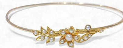
天然真珠ブレス 英国 1890年頃 金 縦55×横60×厚み8mm 内周16cm 税込 352,000円