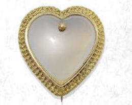
ハート粒金細工ブローチ 英国もしくはイタリア 1870年頃 カルセドニー、金 縦29×横27×厚み7mm 税込 495,000円