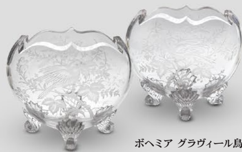
ボヘミア グラヴィール鳥文花器 チェコ 1900年頃 縦15×横16×奥行8.5cm 各 税込 88,000円