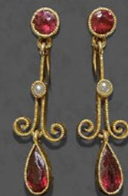
ガーネットイヤリング 英国 1920年頃 天然真珠、9金 縦30×横9×厚み5mm 税込 198,000円