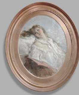
シャルル・シャプラン「婦人像」油絵 フランス 19世紀後期頃 額寸：縦88×横73cm 税込 1,045,000円