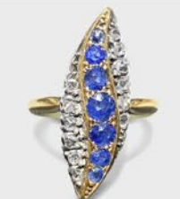
サファイア & ダイヤリング 英国 19世紀後期頃 金、銀 幅26×厚み6mm 12号(サイズ直し無料) 税込 550,000円