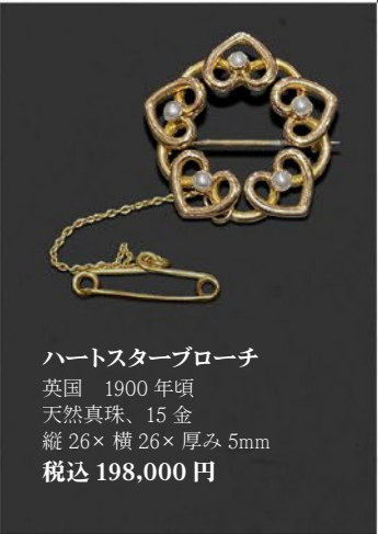
ハートスターブローチ 英国 1900年頃 天然真珠、15金 縦26×横26×厚み5mm 税込 198,000円