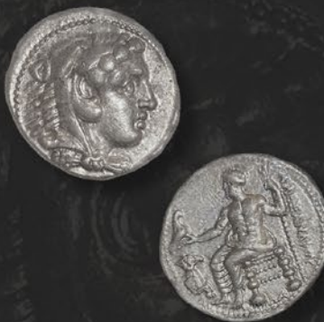
アレキサンダー大王銀貨 テトラドラクマ ダマスカス鑄 紀元前 330~320 年頃 表：ヘラクレスに化身した大王の横顔 裏：玉座に座ったゼウス 税込 418,000 円