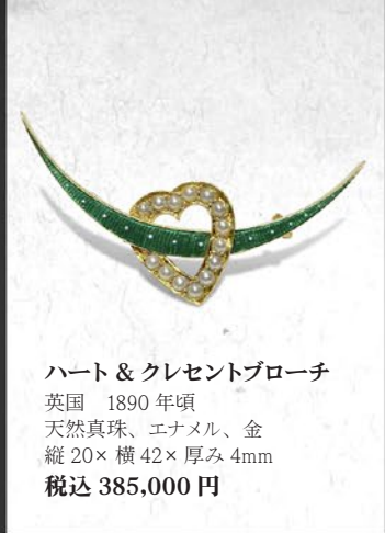
ハート & クレセントブローチ 英国 1890年頃 天然真珠、エナメル、金 縦20×横42×厚み4mm 税込 385,000円