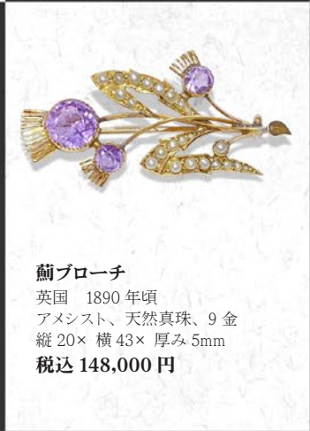
薊ブローチ 英国 1890年頃 アメシスト、天然真珠、9金 縦20×横43×厚み5mm 税込 148,000円