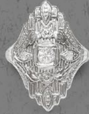
アールデコ・ダイヤモンドリング 推定米国 1930年頃 18金WG 幅22×厚み6mm 11.5号(サイズ直し無料) 税込 396,000円