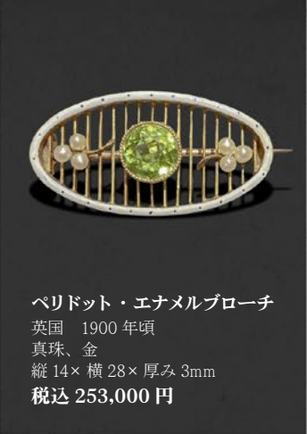
ペリドット・エナメルブローチ 英国 1900年頃 真珠、金 縦14×横28×厚み3mm 税込 253,000円