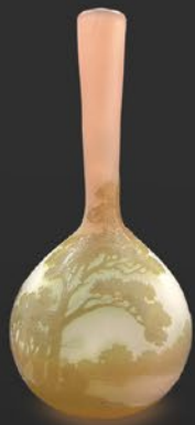
ガレ 湖水風景文花瓶 フランス 1918~1931年 被せガラス 酸化腐食彫り 高さ17×幅8.3×奥行6.1cm 税込 308,000円 (口に削り跡)