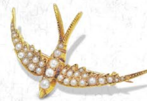
天然真珠燕ブローチ 英国 1890年頃 金 縦25×横45×厚み7mm 税込 495,000円