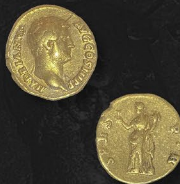
ハドリアヌス帝金貨 アウレリウス 紀元 117~138 年頃 表：皇帝の肖像 裏：希望の女神スペース 特別価格 税込 1,650,000 円