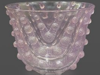
ルネ・ラリック ヴィシー花器 フランス 1937年のモデル パチネ 底面にR・Laliqueのサイン 高さ17×幅20×奥行13.2cm 税込 495,000円