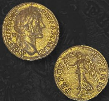
アントニウス・ピウス帝金貨 アウレリウス ローマ鑄 紀元 156~157 年頃 表：皇帝の肖像 裏：勝利の女神ヴィクトリー 税込 1,980,000 円