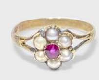
ルビー・デイジーリング 英国 19世紀後期頃 天然真珠、金 幅9×厚み5mm 10号(サイズ直し無料) 税込 165,000円