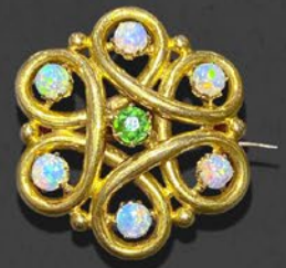
デマントイドガーネット & オパールブローチ 英国 1900年頃 金 縦27×横25×厚み6mm 税込 605,000円