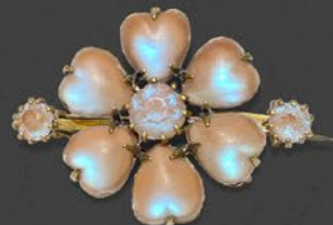
サフィレット硝子ブローチ チェコ 20世紀初期頃 真鍮 縦25×横34×厚み7mm 税込 261,800円