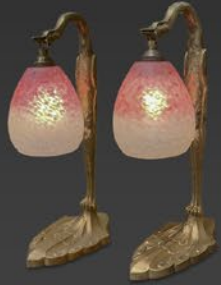
シュナイダー ペアランプ フランス 1925年頃 縦37.5×横20.5×奥行10.5cm 税込 605,000円