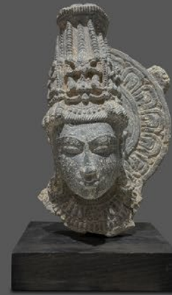
ヴィシャス神頭像 インド・ラジャスタン 10～12世紀頃 碧岩 縦42×横23.5×奥行17cm (台含む) 税込 770,000円