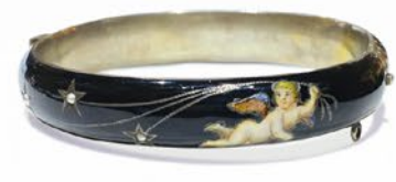
天使エナメル・バングル オーストリア 19世紀後期頃 シードパール、銀 幅10×厚み3mm 内周15.5cm 税込 198,000円