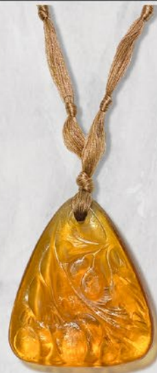
ルネ・ラリック ナナカマド文ペンダント フランス 1920年のモデル 縦50×横41×厚み11mm 72cm 税込 437,800円