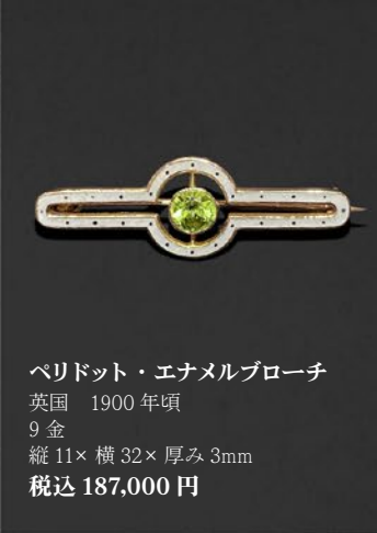
ペリドット・エナメルブローチ 英国 1900年頃 9金 縦11×横32×厚み3mm 税込 187,000円