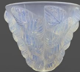
ルネ・ラリック モアサック花瓶 フランス 1927年のモデル オパールセント硝子 底面にR・Laliqueのサイン 高さ13×幅15×奥行15cm 税込 528,000円