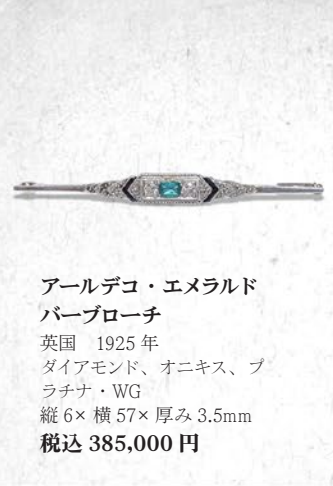
アールデコ・エメラルド パールブローチ 英国 1925年 ダイヤモンド、オニキス、 プラチナ・WG 縦6×横57×厚み3.5mm 税込 385,000円