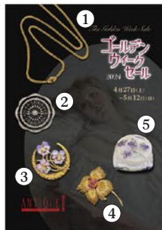
表紙掲載品の詳細