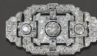
アールデコ・ダイヤブローチ

18 世紀から 19 世紀初頭にかけてブルーエナメルや青い硝子をフェイスの背景としダイヤや真珠をセットした金の台座をその上に載せたリングが流行した。マリー・アントワネットの肖像にも同様のリングを嵌めたものがある。