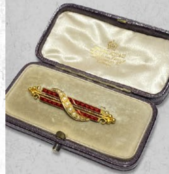
天然真珠エナメルブローチ 19世紀末頃 金・オリジナルボックス付 縦45×横9×厚み6mm 税込 418,000円