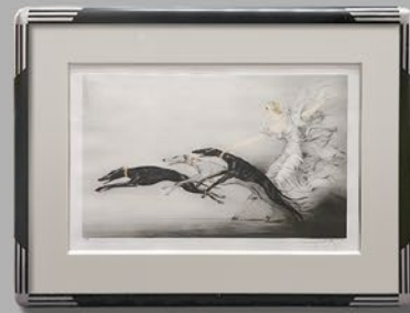
ルイ・イカール「スピード」 フランス 額寸：縦70×横95cm 税込 638,000円