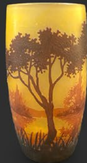
ドーム兄弟 秋香水風景文杯 フランス 1920年頃 被せガラス、酸化腐食彫り 高さ12×幅6.4×奥行6.4cm 税込 495,000円