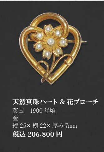
天然真珠ハート & 花ブローチ 英国 1900年頃 金 縦25×横22×厚み7mm 税込 206,800円