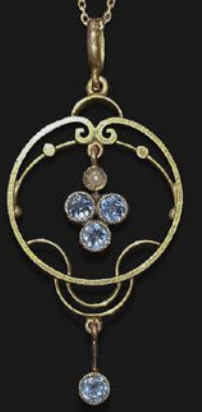
アクアマリンペンダント 英国 1910年頃 シードパール、 9金 10金現代チェーン 縦37×横9×厚み2mm 41cm 税込 159,500円