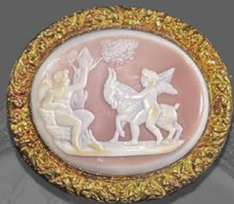
天使カメオブローチ イタリア 19世紀前期頃 シェル、金 縦27×横30×厚み8mm 税込 264,000円