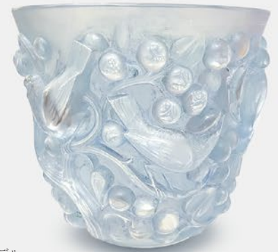
ルネ・ラリック アヴァロン花器 フランス 1927年のモデル パチネ 底面にR・Laliqueのサイン 高さ14.5×幅16.2×奥行16.2cm 税込 495,000円