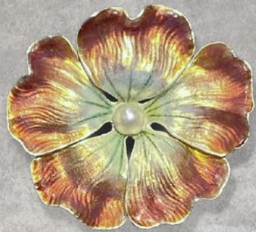
エナメルブローチ 推定米国 20世紀初頭頃 天然真珠、エナメル、ゴールド 縦21×横22×厚み8mm 税込 638,000円