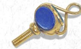
フォブ・ウォッチキー 英国 19世紀前期頃 ラピス、ブラッドストーン、 カーネリアン、金 縦38×横22×厚み2.5mm 税込 99,000円