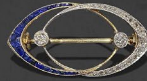
サファイア & ダイヤブローチ オーストリア 1920年代頃 プラチナ、14金 縦19×横37×厚み5mm 税込 693,000円