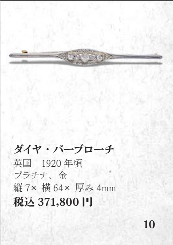
ダイヤ・パールブローチ 英国 1920年頃 プラチナ、金 縦7×横64×厚み4mm 税込 371,800円