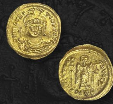
モーリス・ティベリウス金貨 ソリダス コンスタンチノーブル鑄 紀元 582~602 年頃 表：皇帝の肖像 裏：天使立像 税込 418,000 円