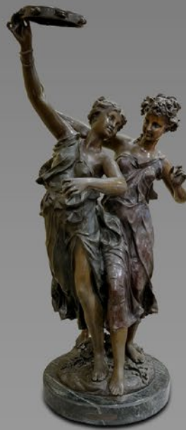
エティエンヌ・ アンリ・デュメージュ 「タンパリンを持った ダンサーたち」 ブロンズ 縦62.5×横25×奥行32cm 税込 748,000円