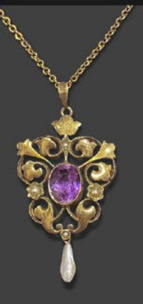
エドワードリアン アメシストペンダント 英国 1910年頃 天淵真珠、金、9金チェーン 縦47×横23×厚み5mm 44cm 税込 253,000円