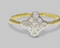
ダイヤモンドリング 英国 1920年頃 プラチナ、18金 幅9×厚み3mm 12号(サイズ直し無料) 税込 187,000円