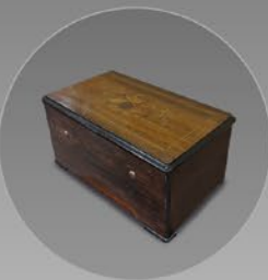
シリンダー式オルゴール スイス 1880年頃 縦31.5×横56×奥行33.5cm 税込 1,595,000円