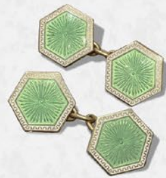
アールデコ・エナメルダブルカフス 英国 1920年代頃 9金 縦11×横11×厚み1mm チェーン 20mm 税込 209,000円