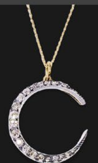
クレセントペンダント 英国 1890年頃 ダイヤ、金、銀 10金現代チェーン 縦36×横26×厚み6mm 41cm 税込 495,000円