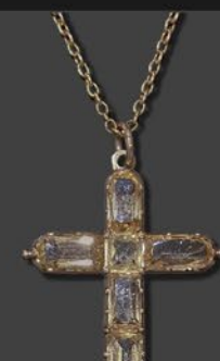
トパーズクロス 英国 19世紀後期頃 金 縦35×横28×厚み4mm 44.5cm 税込 572,000円