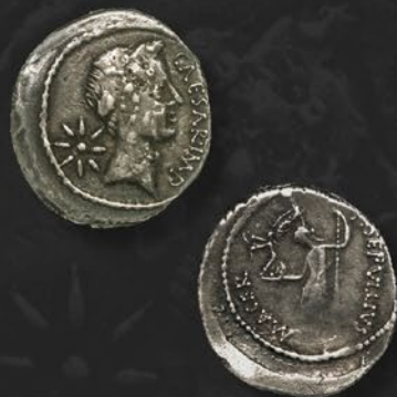
ユリウス・カエサル銀貨 デナリウス ローマ鑄 紀元前 44 年 表：カエサル右向き頭像と八点星 裏：ヴィーナスを持つヴィクトリー 特別価格 税込 495,000 円