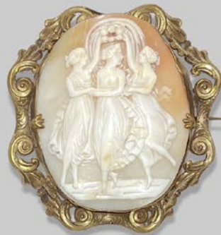
三美神カメオブローチ イタリア 19世紀後期 コロニアル貝、GP 縦65×横61×厚み15mm 税込 140,800円

グランドツアーでボンベイを訪れた貴族の子弟は ヴェスヴィオ火山の粘土室の溶岩であるラーヴァを 浮き彫り彫刻したカメオを好んで買い求めた。 この作品は状態も非常に良好でダイアナ、プシュケ、 フローラ等の女神をモチーフとした珍しい黒色の ラーヴァカメオ。