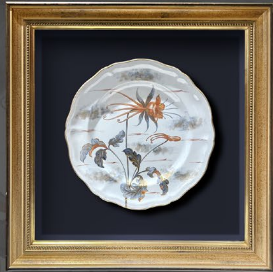
エミール・ガレ オダマキ文皿 フランス 19世紀後期頃 軟質磁器 額寸：縦42×横42cm 税込 660,000円