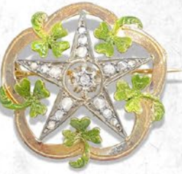
星とクローバーブローチ フランス 1910年頃 ダイヤモンド、エナメル、 プラチナ、18金 縦30×横30×厚み12mm 税込 638,000円