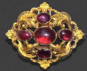
ガーネット・レボゼブローチ 英国 19世紀中期頃 金 縦42×横47×厚み13mm 税込 594,000円