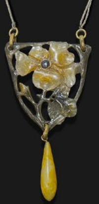
アールヌーヴォー 獣角ネックレス フランス 19世紀末頃 ホーン 縦95×横50×厚み9mm 66cm 税込 363,000円