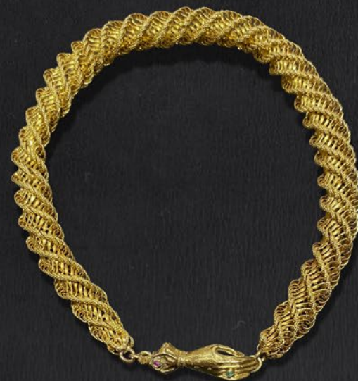
ジョージアン・ゴールドブレス