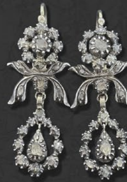
ジョージアン・ダイヤモンドピアス 英国 19世紀後期頃 金、銀 縦50×横17×厚み4mm 税込 858,000円