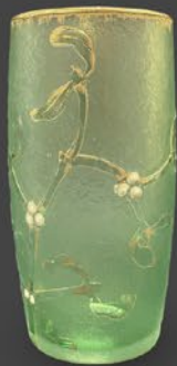
ドーム兄弟 寄生木文杯 フランス 1900年頃 エナメル彩、金彩、ジブレ、酸化腐食彫り 高さ12.5×幅6.2×奥行6.3cm 税込 308,000円