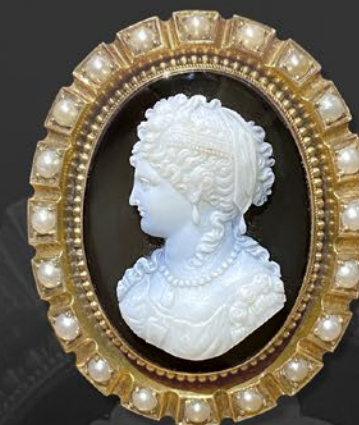
ストーンカメオブローチ

オールドマイナカットからオールドヨーロッパ、トランジションカットまで様々なカットのダイヤモンドを隙間なく敷き詰めた眩い輝きを放つアールデコ期の大作。エッジには極小のミルグレインも施されている。