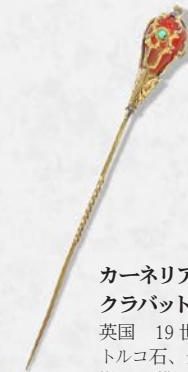
カーネリアン・クラバットピン 英国 19世紀末頃 トルコ石、金 縦83×横10×厚み10mm 税込 132,000円