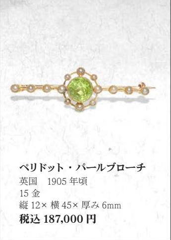
ペリドット・パールブローチ 英国 1905年頃 15金 縦12×横45×厚み6mm 税込 187,000円