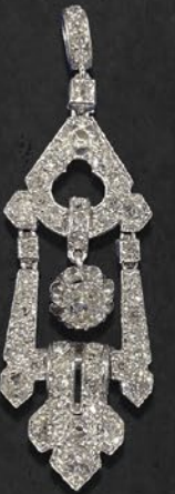
ダイヤモンドペンダント イギリス 1920年頃 プラチナ 縦46×横15×厚み5mm 税込 968,000円