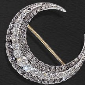
ダイヤモンド三日月ブローチ フランス 1890年頃 18金、銀 縦30×横31×厚み8mm 税込 1,408,000円