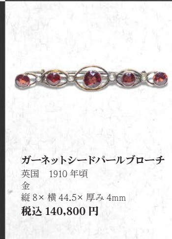
ガーネットシードパールブローチ 英国 1910年頃 金 縦8×横44.5×厚み4mm 税込 140,800円