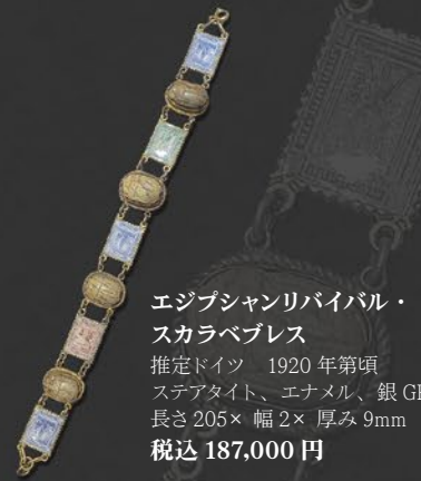
エジプシャンリバイバル・スカラベプレス 推定ドイツ 1920年第頃 ステアタイト、エナメル、銀GP 長さ205×幅2×厚み9mm 税込 187,000円