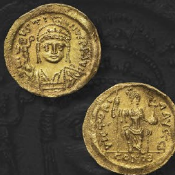
ユスティニアヌス二世金貨 ソリダス コンスタンティノーブル鑄 紀元 565~578 年 表：軍装皇帝正面胸像 裏：コンスタティノポリス立像 税込 396,000 円