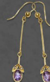
アメシストピアス 英国 1910年頃 シードパール、金 縦40×横7×厚み3mm 税込 198,000円