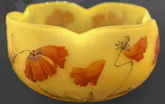
ドーム兄弟 ヒナゲシ文鉢 フランス 1900年頃 エナメル彩、金彩、被せガラス、酸化腐食彫り 高さ6.5×幅21.1×奥行21.1cm 税込 968,000円