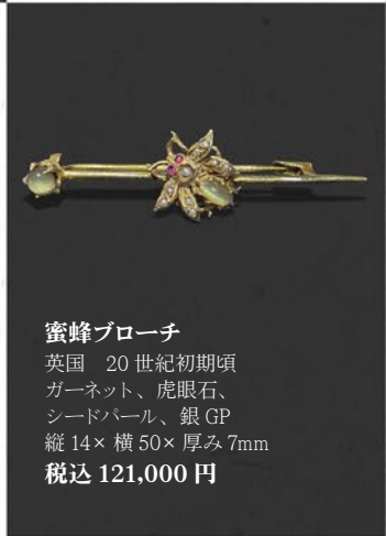
蜜蜂ブローチ 英国 20世紀初期頃 ガーネット、虎眼石、 シードパール、銀GP 縦14×横50×厚み7mm 税込 121,000円