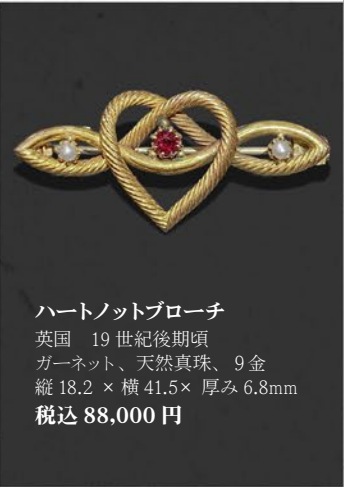
ハートノットブローチ 英国 19世紀後期頃 ガーネット、天然真珠、9金 縦18.2×横41.5×厚み6.8mm 税込 88,000円