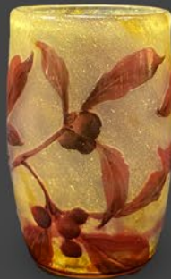
ドーム兄弟 ナナカマド文杯 フランス 1900年頃 エナメル彩、参加腐食彫り、被せガラス 高さ8×幅5.2×奥行5.4cm 税込 385,000円