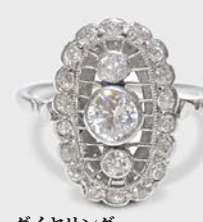
ダイヤモンドリング 英国 20世紀初期頃 プラチナ 幅15×厚み5mm サイズ12号(サイズ直し無料) 税込 396,000円