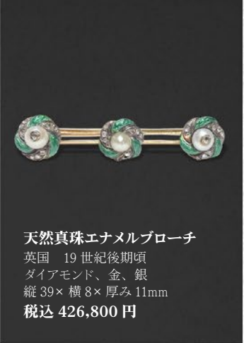
天然真珠エナメルブローチ 英国 19世紀後期頃 ダイヤモンド、金、銀 縦39×横8×厚み11mm 税込 426,800円