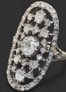
ローズカットダイヤモンドリング 西ヨーロッパ 19世紀中期頃 金、銀 幅31×厚み6mm 12.5号(サイズ直し無料) 税込 1,760,000円