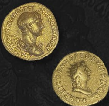
トラヤヌス帝金貨 アウレリウス ローマ鑄 紀元 116~117 年 表：皇帝の肖像 裏：太陽神ソール 税込 1,650,000 円