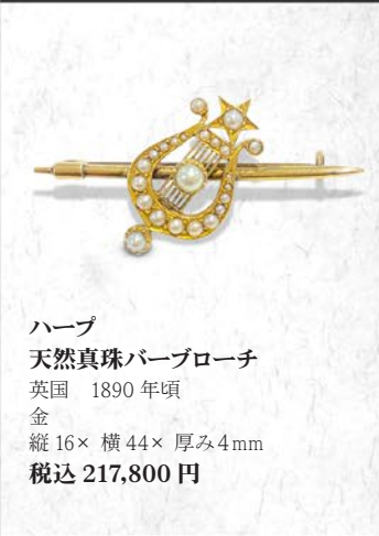
ハーブ 天然真珠パールブローチ 英国 1890年頃 金 縦16×横44×厚み4mm 税込 217,800円