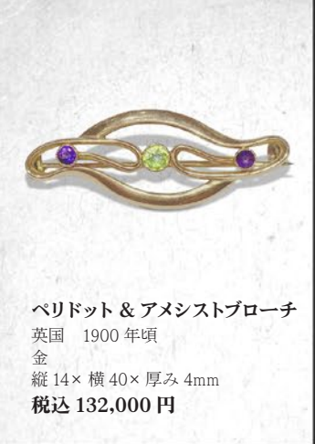
ペリドット & アメシストブローチ 英国 1900年頃 金 縦14×横40×厚み4mm 税込 132,000円