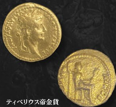
ティベリウス帝金貨 アウレリウス ルグドゥヌム鑄 紀元 14~37 年頃 表：皇帝の肖像 裏：リウイア・ドルシッラが女神ハックスとして 矢と枝を持ち座る姿 税込 1,595,000 円