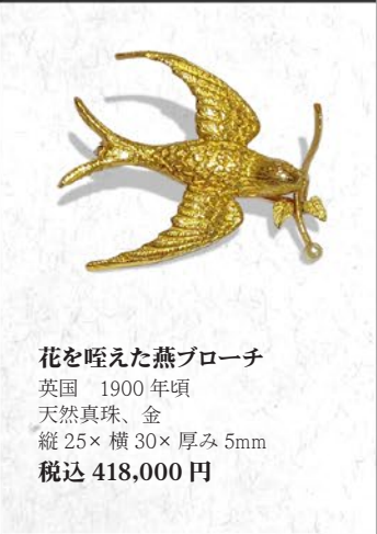
花を啜えた燕ブローチ 英国 1900年頃 天然真珠、金 縦25×横30×厚み5mm 税込 418,000円