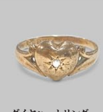
ダイヤモンドハートリング 英国 1917年刻印 9金 幅9×厚み3mm 14号(サイズ直し無料) 税込 154,000円