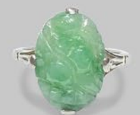
翡翠リング 英国 1930年代頃 ホワイトゴールド 幅15×厚み5mm 7.5号(サイズ直し無料) 税込 176,000円