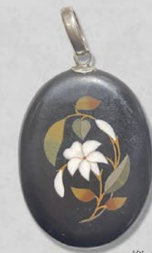
フローレンス モザイク ペンダント イタリアもしくは英国 19世紀後期頃 大理石 縦45×横34×厚み6mm 税込 96,800円