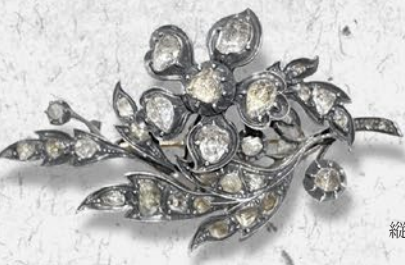
ジョージアン ローズカット ダイヤモンドブローチ 英国 19世紀初期頃 金、銀 縦33×横62×厚み15mm 税込 1,408,000円

昨今はヨーロッパの市場でも目にすることが少なくなった大振りのローズカットを使用したスプレーブローチ。ダイヤモンドの原石の形を残したガードルを覆輪で囲むセッティングはまさにジョージアン期の特徴。立体的なダイヤモンドの花が胸元に華開く逸品。