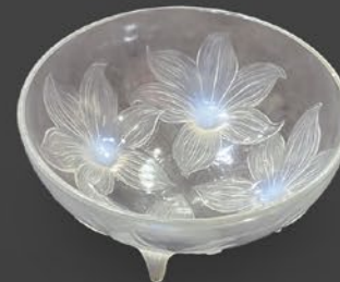
ルネ・ラリック 百合文鉢 フランス 1924年のモデル オパールセント硝子 底面にR・Laliqueのサイン 高さ12.7×幅23.8×奥行23.8cm 税込 437,800円