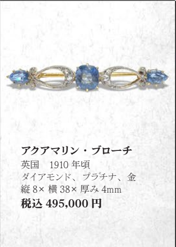
アクアマリン・ブローチ 英国 1910年頃 ダイヤモンド、プラチナ、金 縦8×横38×厚み4mm 税込 495,000円