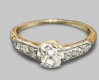
オールドカットダイヤモンドリング 英国 20世紀初期頃 プラチナ、18金 幅5×厚み5mm 12号(サイズ直し無料) 税込 253,000円