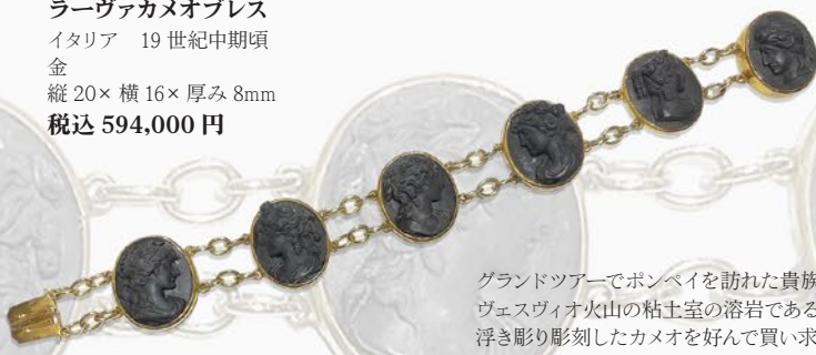
ラーヴァカメオブレス イタリア 19世紀中期頃 金 縦20×横16×厚み8mm 税込 594,000円

グランドツアーでボンベイを訪れた貴族の子弟は ヴェスヴィオ火山の粘土室の溶岩であるラーヴァを 浮き彫り彫刻したカメオを好んで買い求めた。 この作品は状態も非常に良好でダイアナ、プシュケ、 フローラ等の女神をモチーフとした珍しい黒色の ラーヴァカメオ。