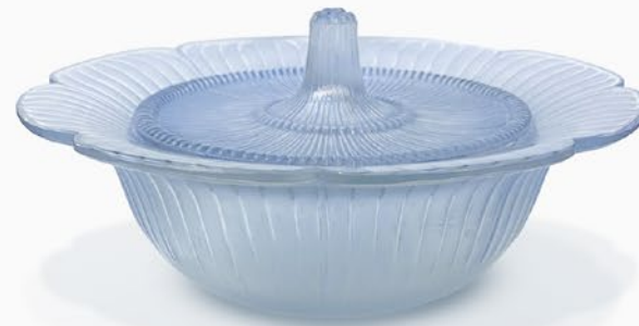
ルネ・ラリック ガティネ蓋物 フランス 1928年のモデル パチネ 底面にR・Laliqueのサイン 高さ10.5×幅19.5×奥行19.5cm 税込 495,000円