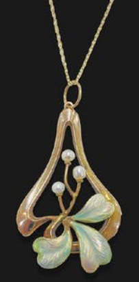
アールヌーヴォー エナメルペンダント 英国 9金、10金現代チェーン、 天然真珠 縦42×横22×厚み5mm 41cm 税込 385,000円