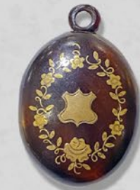
ピケロケット 英国 19世紀後期頃 金、黓甲 縦40×横26×厚み12mm 税込 165,000円