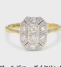
アールデコ・ダイヤモンドリング 英国 1920年頃 プラチナ、18金 幅10.5×厚み9mm 11.5号(サイズ直し無料) 税込 275,000円