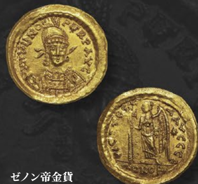
ゼノン帝金貨 ソリダス コンスタンティノーブル鑄 紀元 474~491 年 第 2 治世 表：軍装した皇帝正面胸像 裏：十字架を持つ長衣のヴィクトリー立像 税込 418,000 円