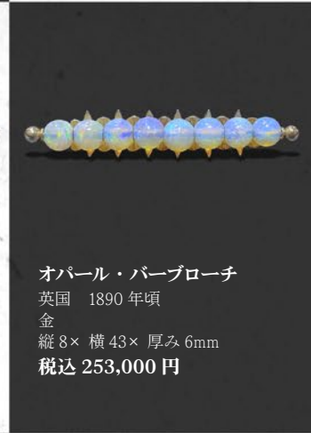
オパール・パールブローチ 英国 1890年頃 金 縦8×横43×厚み6mm 税込 253,000円