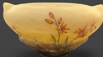
ドーム兄弟 クロコスミ文鉢 フランス 1900年頃 エナメル彩、酸化腐食彫り 高さ8.5×幅5.5×奥行5.5cm 税込 858,000円