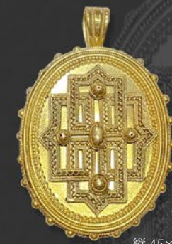
エトルリアン 様式 ロケット イタリア 1870年頃 金、硝子 縦45×横36×厚み12mm 税込 605,000円