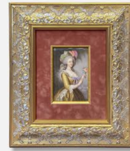
フィチェンロイター 陶板画 ドイツ 19世紀後期頃 額寸：縦43×横39.8cm 税込 528,000円