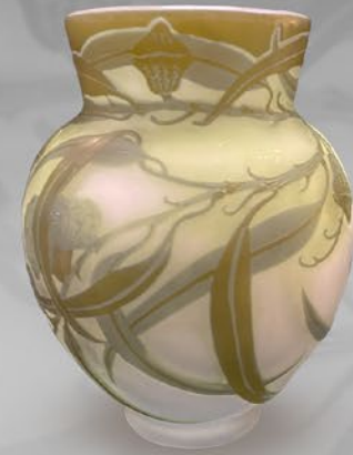
ガレ ユーカリ文花器 フランス 1904~1931年頃 被せガラス、酸化腐食彫り 高さ20.3×幅15×奥行15cm 税込 495,000円