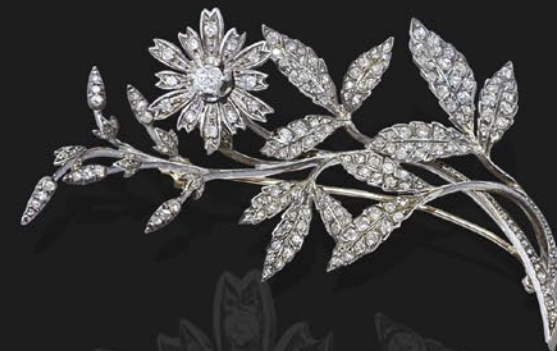
トレンブランブローチ

ゴールドラッシュが起きる以前の 1800 年頃の金の産出量は 1920 年頃に比べ 100 分 1 程しかなく、当時金の装飾品を所有できる者は一部の貴族や王族に限られていた。そうした時代には貴重で高価な金を立体的に表現する超絶技巧が駆使されており、この作品も驚くほど軽量に作られている。