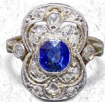
サファイア・トワエモアリング 英国 1895年刻印 ダイヤ、プラチナ、18金 幅8×厚み5mm 13.5号(サイズ直し無料) 税込 426,800円