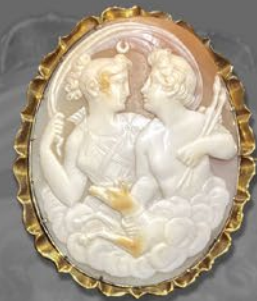
アポロンとダイアナ カメオブローチ イタリア 19世紀後期頃 コロニアル貝、金 縦51×横44×厚み11.5mm 税込 396,000円