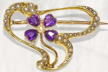
アールヌーヴォー・アメシストブローチ 英国 1890年頃 天然真珠、15金 縦22×横30×厚み5mm 税込 327,800円