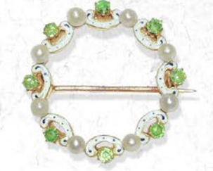
デマントイドガーネット・ サークルブローチ 英国 1900年頃 天然真珠、エナメル、金 縦25×横25×厚み6mm 税込 594,000円