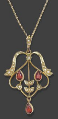
ガーネット・パール ペンダント 英国 1900年頃 9金 9金チェーン 縦48×横30×厚み4mm 38.5cm 税込 176,000円