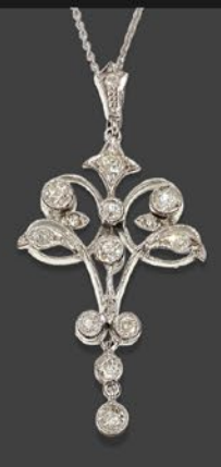
エドワードリアン ダイヤモンドペンダント 英国 1910年頃 プラチナ オリジナルボックス 縦55×横28×厚み5mm 42cm 税込 1,408,000円