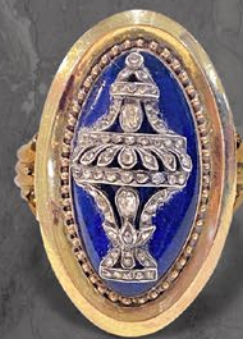
ジョージアン・ブリストルガラスリング

未だ宮内での灯りが蠟燭の下、薄暗い時代にダイヤモンドの輝きを活かそうと生み出された技法トレンブラン。そよ風にも花の部分が揺れ動くように作られ、古き良き輝きを放つ逸品。