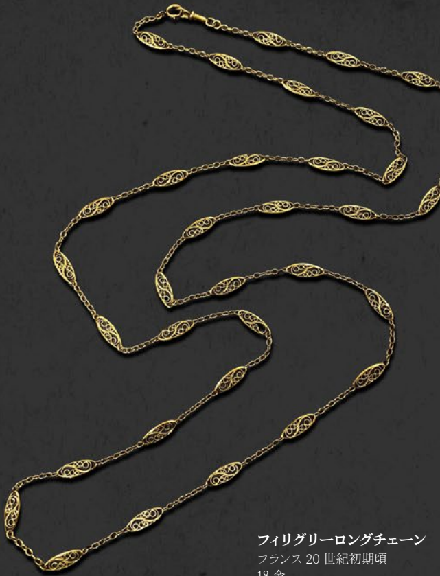
フリルグリーロングチェーン フランス 20世紀初期頃 18金 140cm 税込 2,178,000円