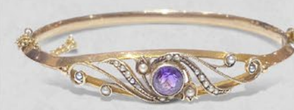
アメシストバンゲル 英国 19世紀後期頃 シードパール、9金 幅10×厚み7mm 税込 253,000円