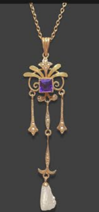
アメシスト天然真珠 ペンダント 英国 20世紀初期頃 金 9金チェーン 縦63×横17×厚み3.8mm 44cm 税込 275,000円