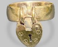
ハートパドロックリング 英国 1905年 9金 幅17×厚み4.8mm 16号(サイズ直し無料) 税込 165,000円