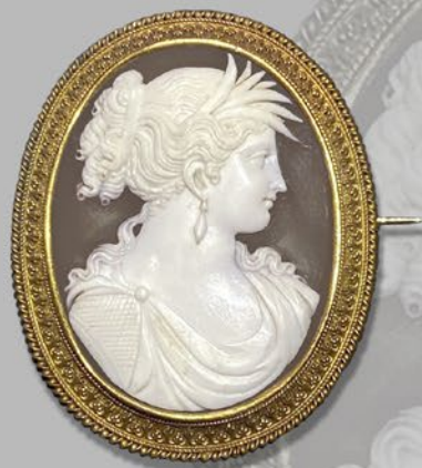
デメテルカメオブローチ イタリア 19世紀後期頃 サルドニア貝、金 縦50×横41×厚み9mm 税込 396,000円