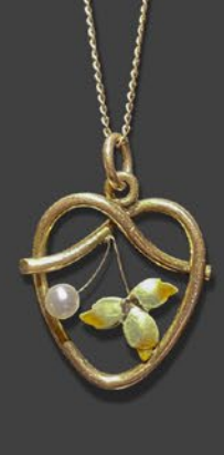
アールヌーヴォーペンダント 英国 1900年頃 エナメル、天然真珠、 金 9金チェーン 縦22×横15×厚み5mm 50cm 税込 151,800円