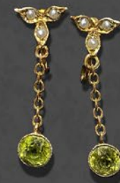
ペリドットイヤリング 英国 1920年頃 シードパール、金 縦27×横10×厚み5mm 税込 176,000円