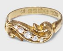
ダイヤモンドリング 英国 1910年刻印 18金 幅7×厚み3mm 12号(サイズ直し無料) 税込 209,000円