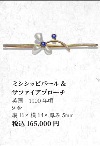
ミシシッピパール & サファイアブローチ 英国 1900年頃 9金 縦16×横64×厚み5mm 税込 165,000円