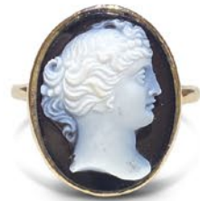
ストーンカメオリング 推定イタリア 19世紀後期頃 オニキス、金 幅19×厚み6mm 14号(サイズ直し無料) 税込 217,800円