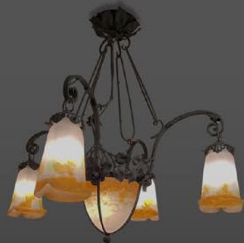
ミュラー 吊りランプ フランス 20世紀初期頃 ヴィクトリフィカシオン 縦65×横50×奥行50cm 税込 770,000円