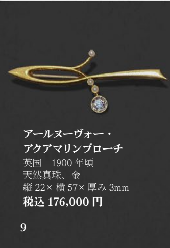
アールヌーヴォー・ アクアマリンブローチ 英国 1900年頃 天然真珠、金 縦22×横57×厚み3mm 税込 176,000円