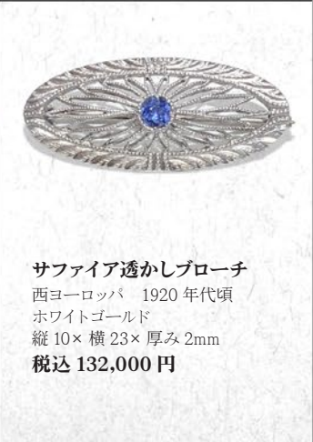
サファイア透かしブローチ 西ヨーロッパ 1920年代頃 ホワイトゴールド 縦10×横23×厚み2mm 税込 132,000円