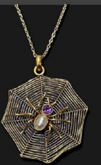
蜘蛛ペンダント 英国 1900年頃 アメシスト、天然真珠、 金、10金現代チェーン 縦2.9×横2.3×厚み4mm 41cm 税込 220,000円