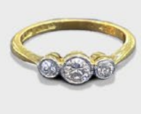
ダイヤトリロジーリング 英国 20世紀初期頃 プラチナ、18金 幅4.5×厚み4mm 8.5号(サイズ直し無料) 税込 250,800円