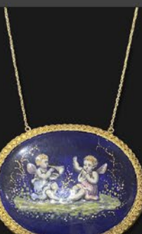
リモージュエナメル ペンダント フランス 1870年頃 銅板、金、18金チェーン 縦42×横51×厚み3mm 44cm 税込 308,000円