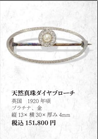
天然真珠ダイヤブローチ 英国 1920年頃 プラチナ、金 縦13×横30×厚み4mm 税込 151,800円