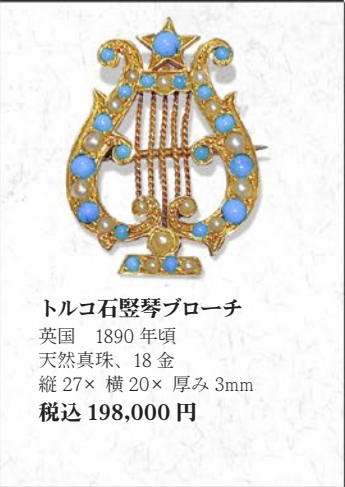
トルコ石豎琴ブローチ 英国 1890年頃 天然真珠、18金 縦27×横20×厚み3mm 税込 198,000円