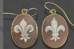
フルールドリス・カメオピアス イタリア 19世紀後期頃 サルドニア貝、9金 縦31×横16×厚み3mm 税込 192,500円