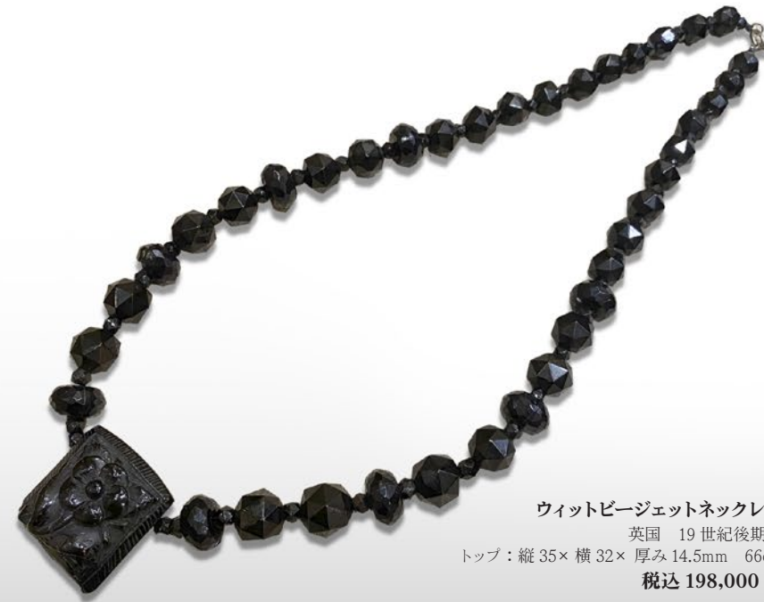
ウィットビージェットネックレス 英国 19世紀後期頃 トップ：縦35×横32×厚み14.5mm 66cm 税込 198,000円

20世紀初頭にはロングチェーンが流行した。その中でも花や葉の模様が立体的に装飾された希少なチェーン、留め具の受けにはフランス製の18金を示す刻印が打たれている。昨今は金の大幅な価格上昇とともにフランスでもその数を急激に減らしている。