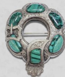
スコティッシュブローチ 英国 19世紀中期頃 孔雀石、銀 縦59×横48×厚み7mm 税込 94,380円