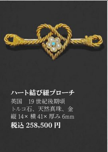
ハート結び紐ブローチ 英国 19世紀後期頃 トルコ石、天然真珠、金 縦14×横41×厚み6mm 税込 258,500円