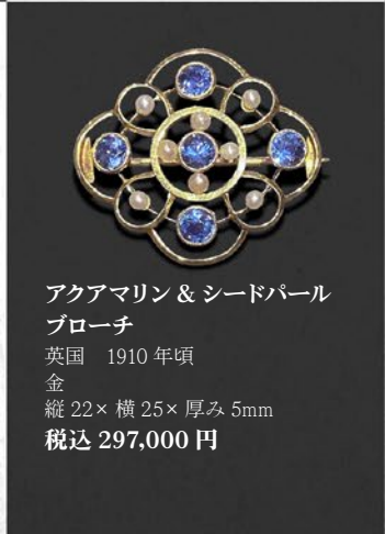
アクアマリン & シードパール ブローチ 英国 1910年頃 金 縦22×横25×厚み5mm 税込 297,000円