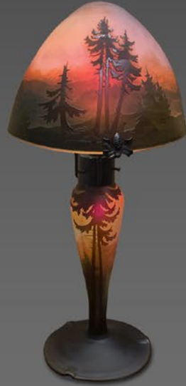
ミュラー 山岳風景文ランプ フランス 1920年頃 縦54×横25×奥行25cm 税込 1,980,000円