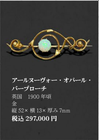
アールヌーヴォー・オパール・ パールブローチ 英国 1900年頃 金 縦52×横13×厚み7mm 税込 297,000円