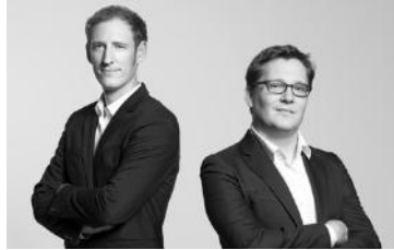
Design by Bernhard I Burkard

Thanks to all people involved in this project: Del Xu for the organisation in Asia, John Ye for the development, engineering and CAD work, Mario Rothenbühler for the photos, Fabian Bernhard and Thomas Burkard for the unique design and spacesaving construction and Matti Walker for the graphic work.