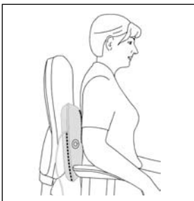
Rugmassage: onderste gedeelte van de rug (lende-wervels)