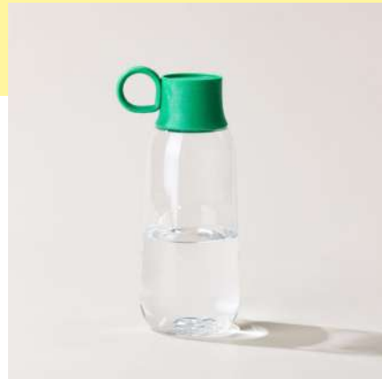
la gourde STREET | 50 cl la plus légère