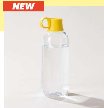
la gourde STREET | 1 L la plus grande