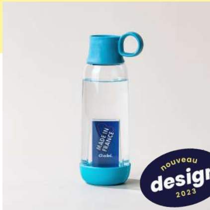
la gourde original | 46 cl la plus personnalisable

pour s'adapter à tous les quotidiens et prendre soin de ses collaborateurs