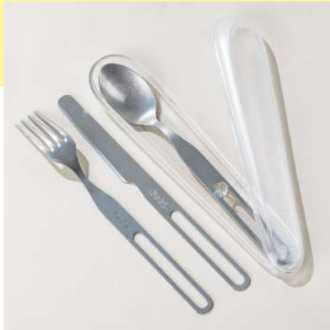
les couverts STREET aussi nomades qu'efficaces