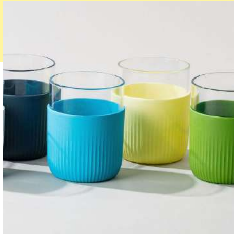
le gobelet original | 28 cl la personnalisation la plus ludique

pour déployer les essentiels du réutilisable avec une même signature design