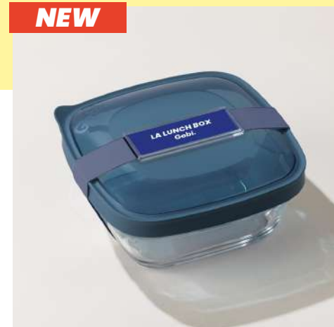
NEW la lunch box indoor | 1,15 L en verre recyclable et 100% étanche