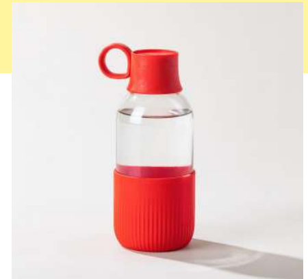
la gourde indoor | 50 cl la plus élégante en verre