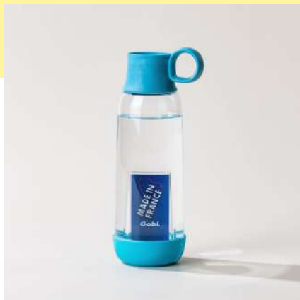
la gourde original | 46 cl la plus personnalisable

pour s'adapter à tous les quotidiens et prendre soin de ses collaborateurs