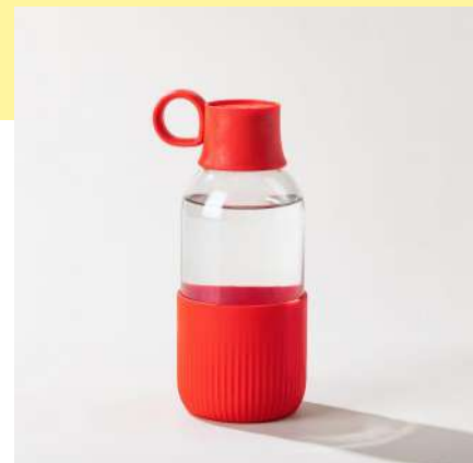
la gourde indoor | 50 cl la plus élégante en verre