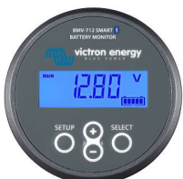
Bluetooth-Erkennung BMV-712 Smart Battery Monitor