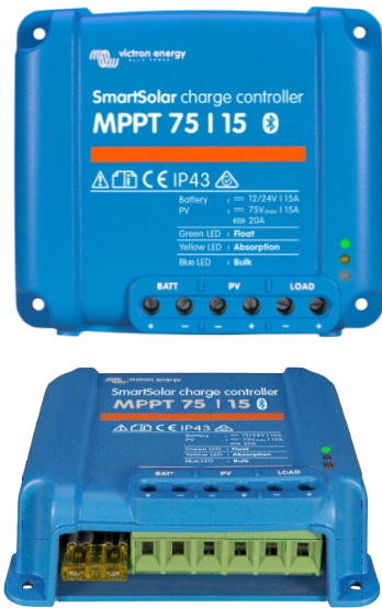
SmartSolar Lade-Regler MPPT 75/15