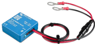
Bluetooth-Erkennung Smart Battery Sense