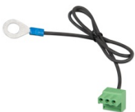
Stecker mit vormontiertem DC-Minus-Kabel (mitgeliefert)