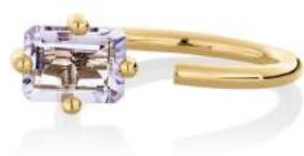
OCTOGONE RING AMETHYST