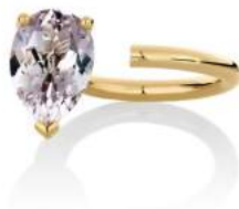
BLOOM RING AMETHYST