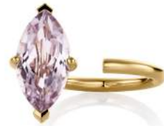
SIGNATURE MARQUISE RING