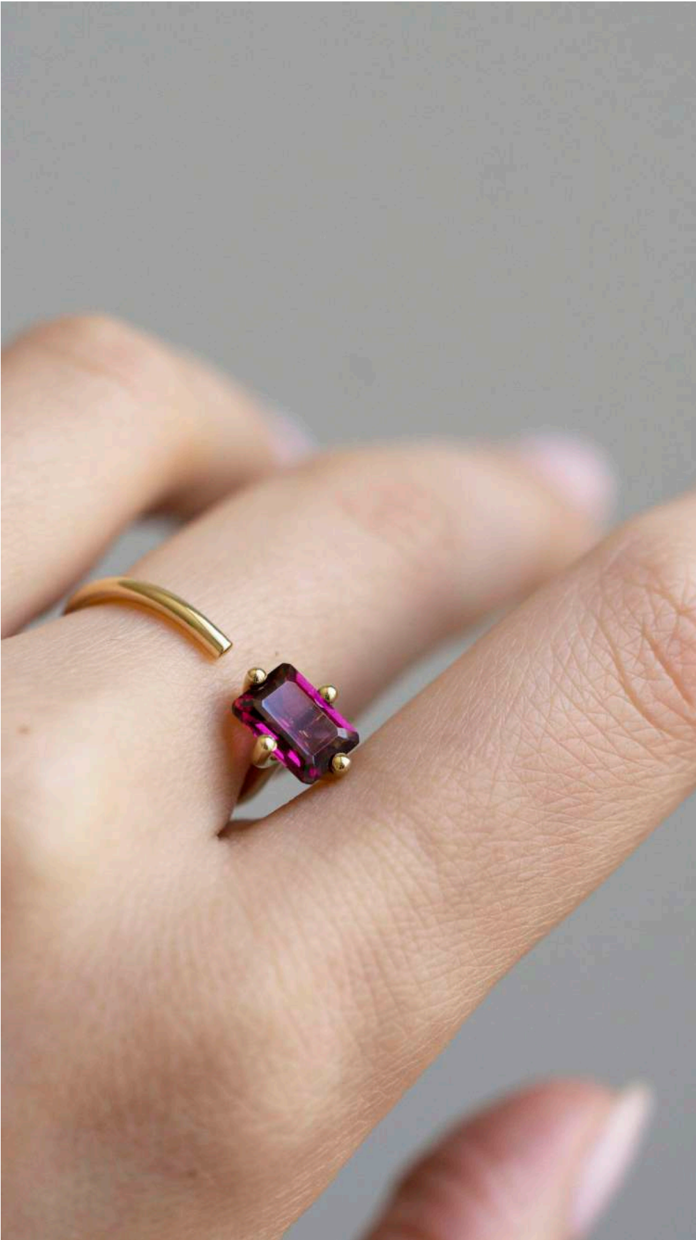
OCTOGONE RING WITH RHODOLITE