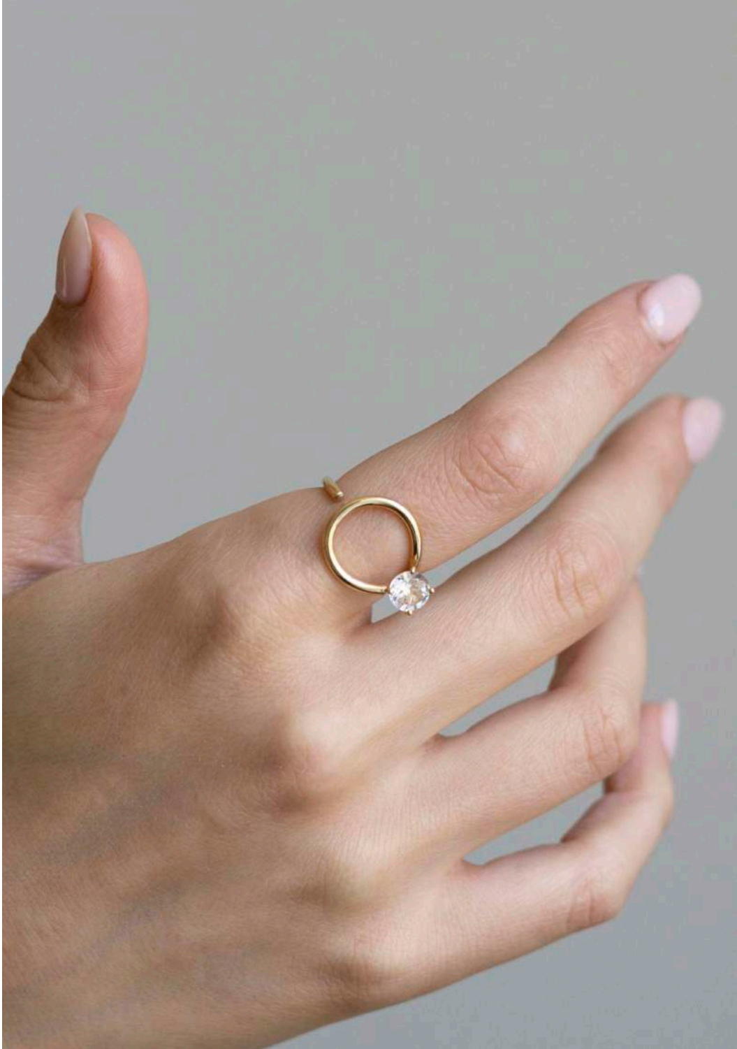
CURL RING WHITE TOPAZ