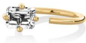
OCTOGONE RING WHITE TOPAZ