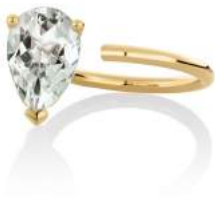
BLOOM RING GREEN AMETHYST