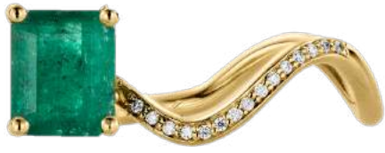
PETITE COMETE EMERALD RING