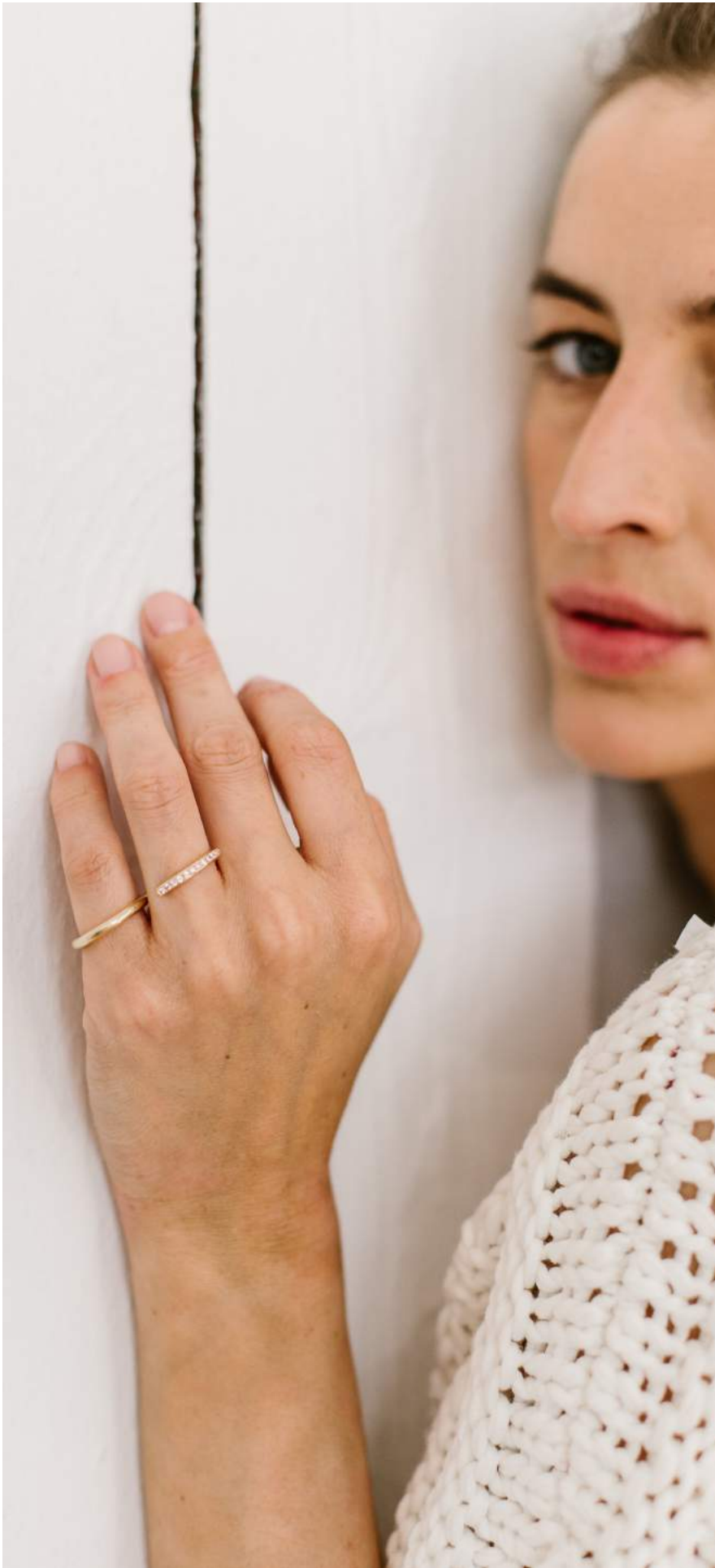
DOUBLE RING PINK SAPPHIRES