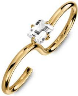
DOUBLE RING WHITE TOPAZ