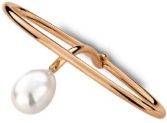
TWO FINGER RING JULIA